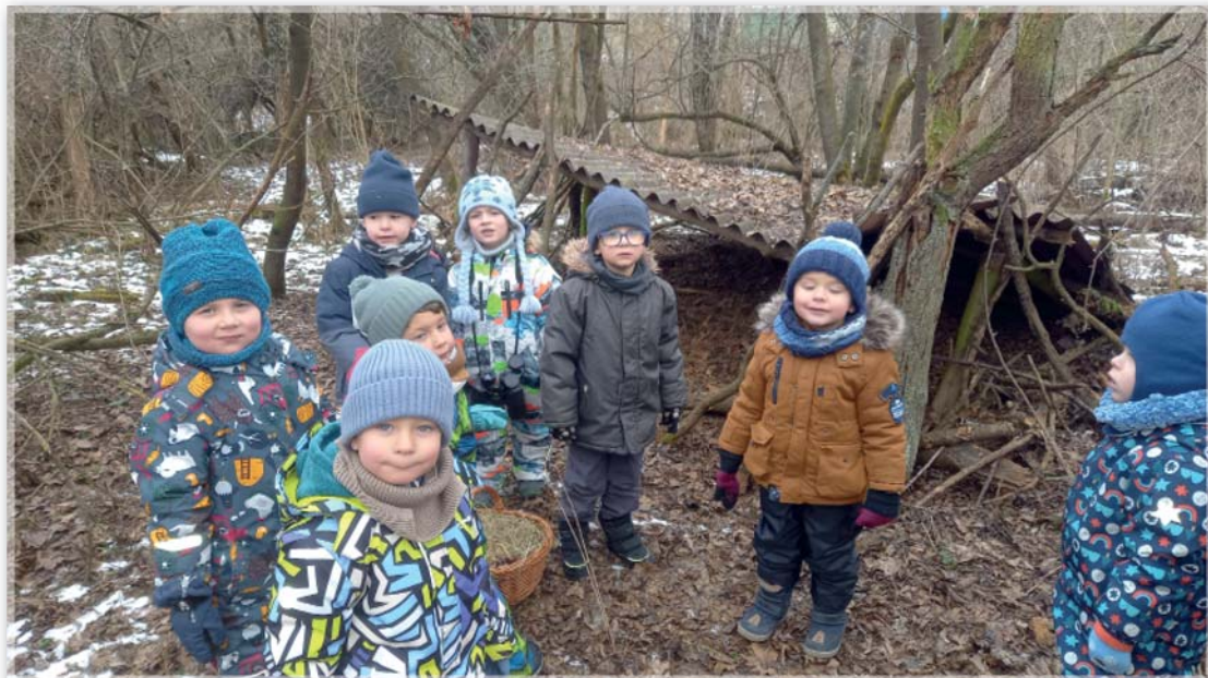
Berušky u krmelce