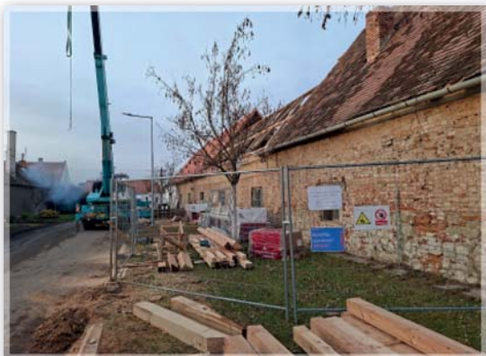
Rekonstrukce střechy bývalého statku

Ojedinele dochovaný zbytkový statek rodiny Magnisů svým vnějším vzhledem připomíná slováckou formu pomoravsko-panonského domu.