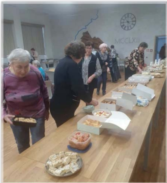
z ochutnávky 13. února 2026