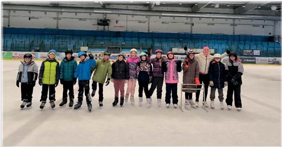
Bruslení – 4. třída