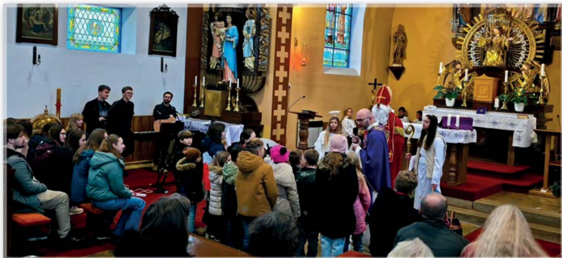
Neděle 7. 12. 2025 – návštěva svatého Mikuláše a jeho družiny po nedělní mši svaté