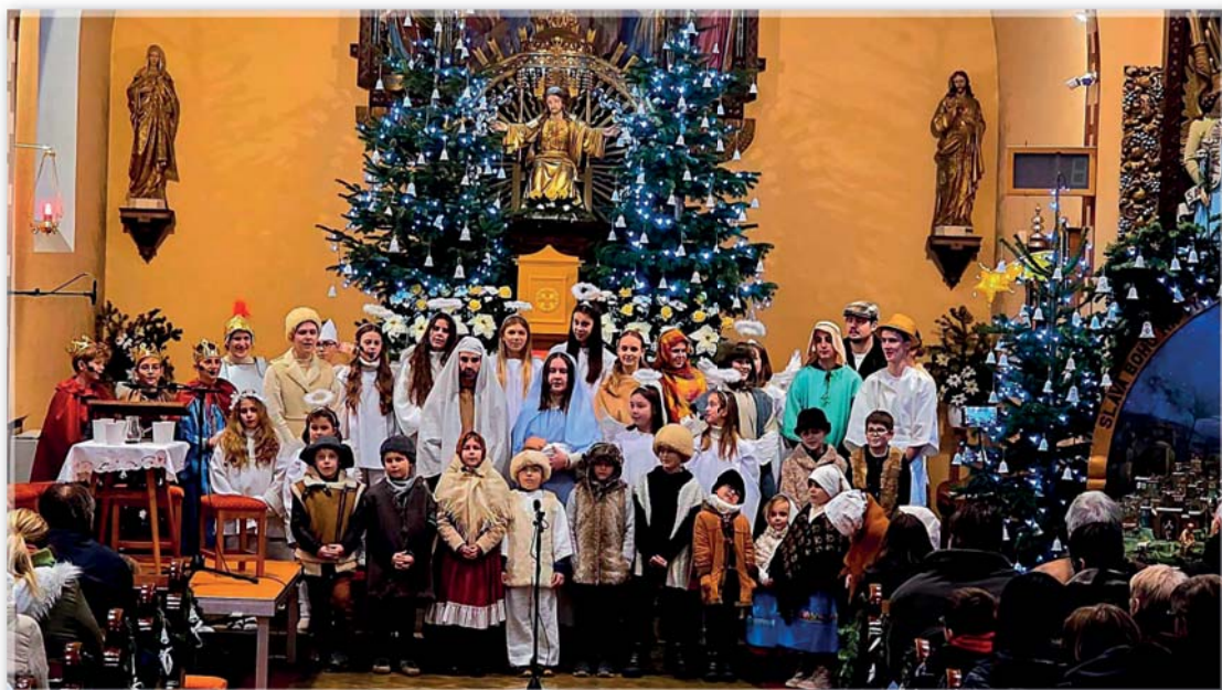
Vánoční pásmo 25.12.2025