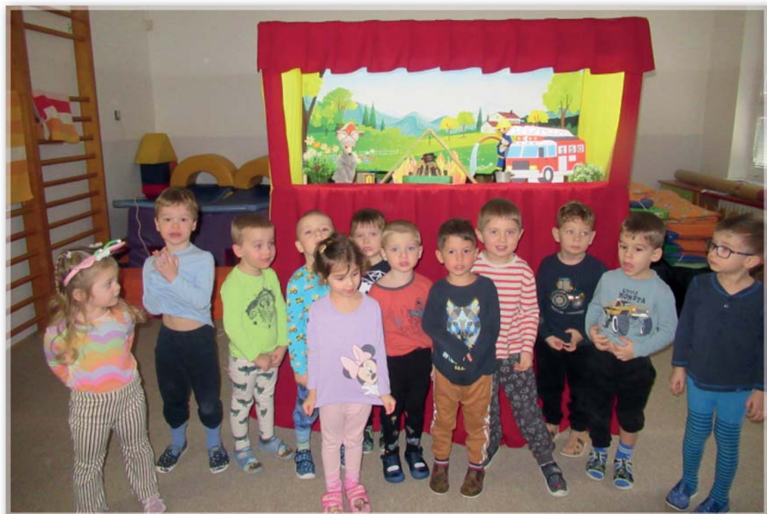
Divadlo - Berušky