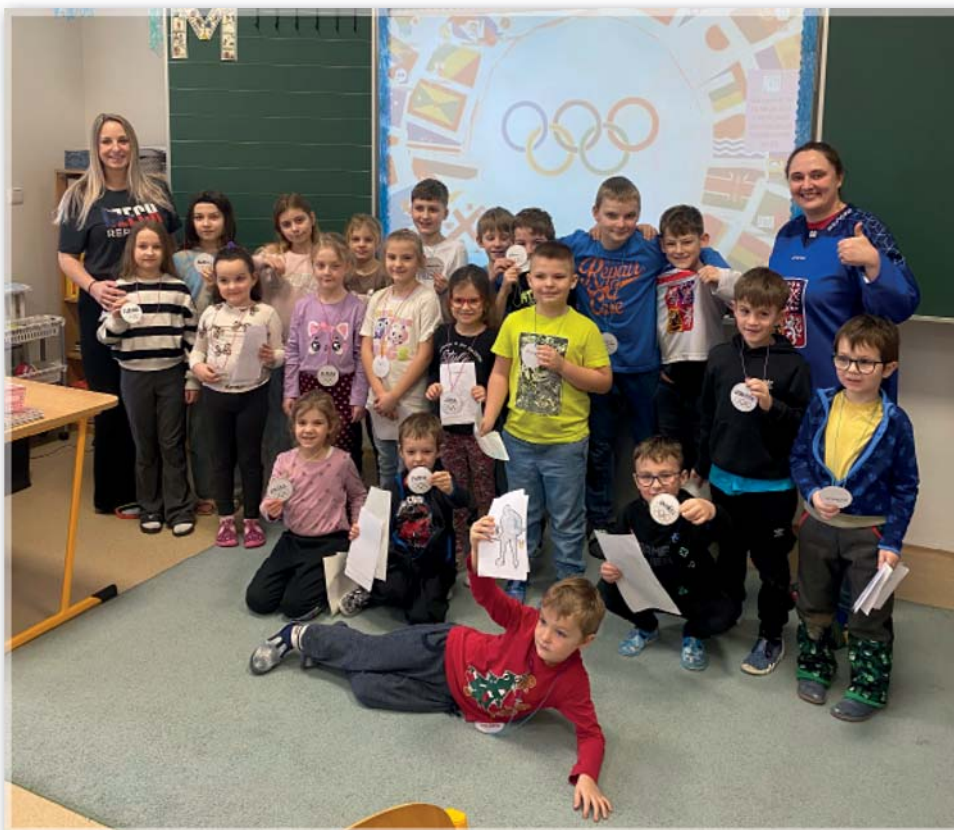
S úsměvem do školy