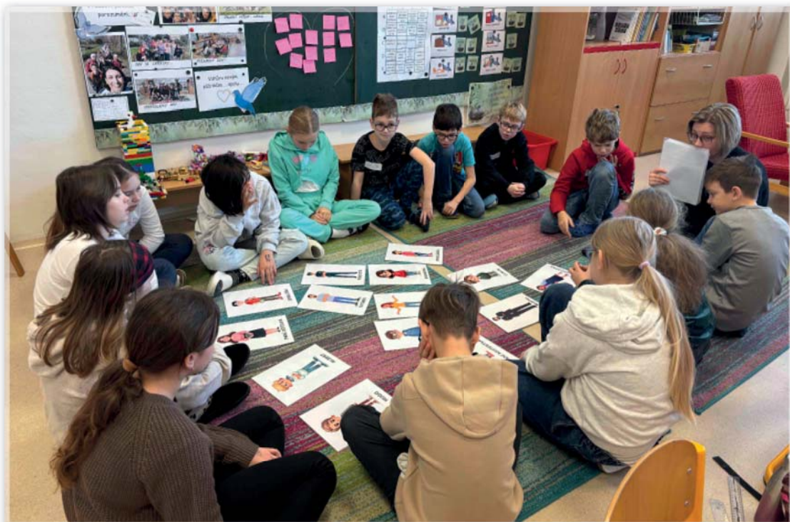
Etické dílny – 4. třída