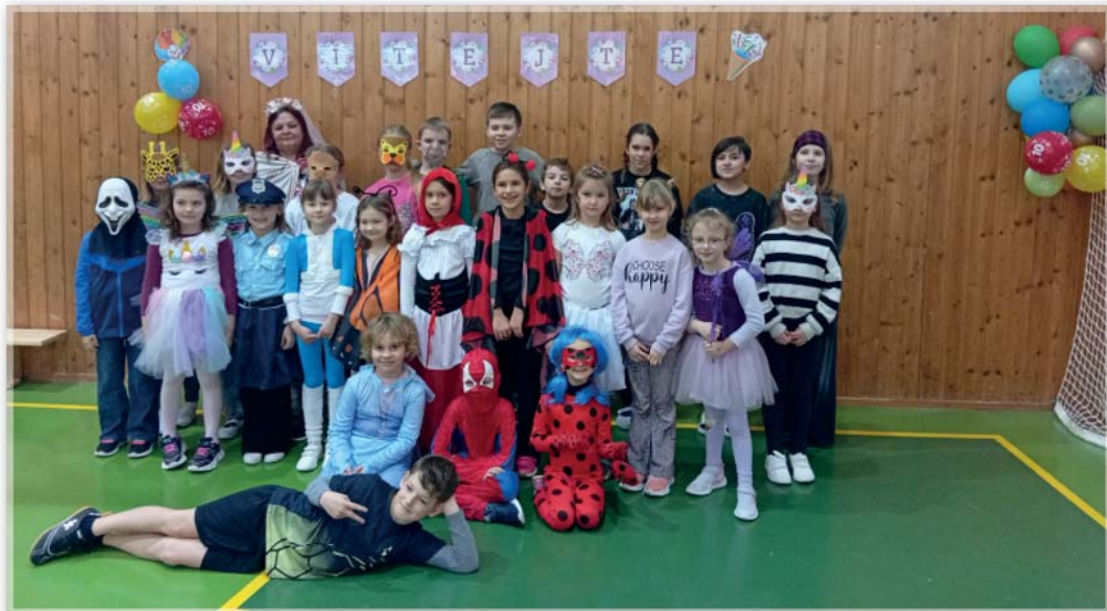
Karneval ve školní družině