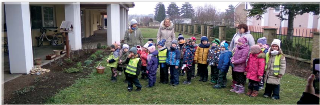
Vánoční zpívání v Domově pokojného stáří