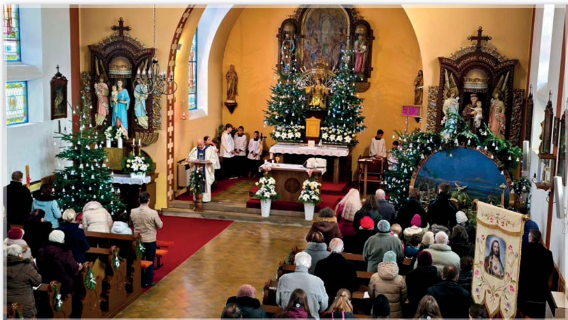
Bohoslužba na začátku nového roku 1.1.2026