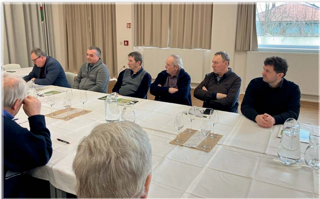
Výroční schůze zahrádkářů – únor 2026