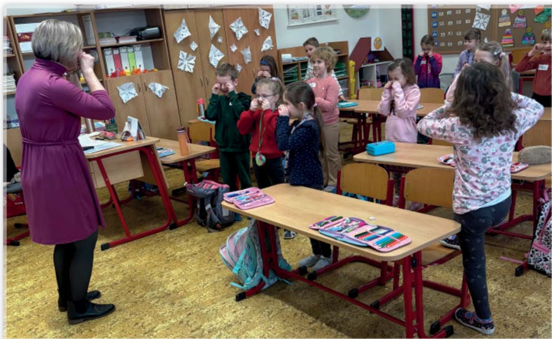
Etické dílny – 1. třída