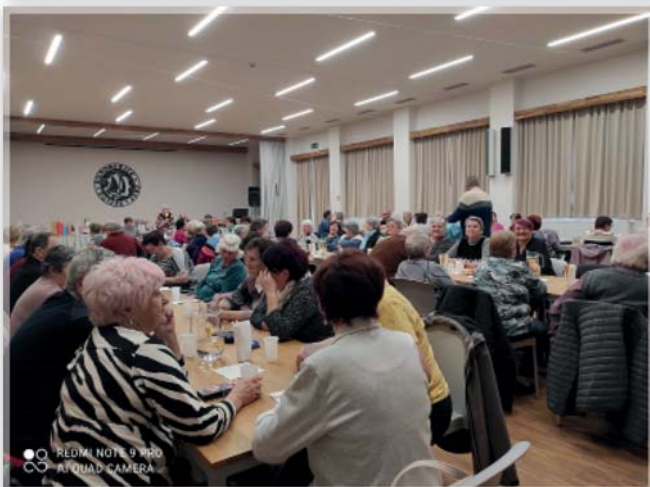
z hodnotící schůze 5. března 2026