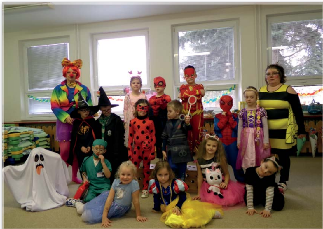
Karneval – Včeličky