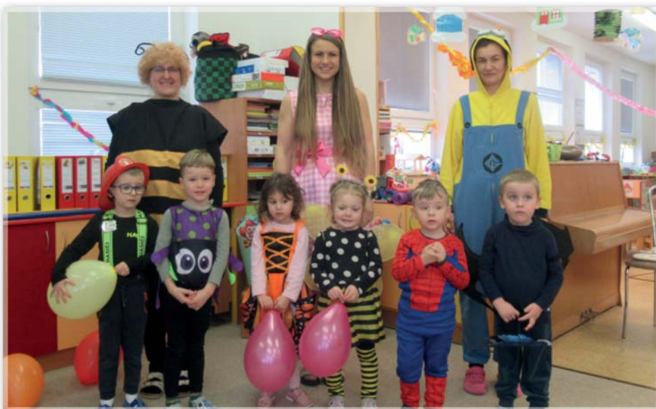
Karneval – Berušky