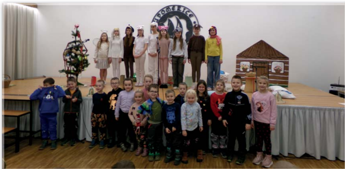
Divadelní představení dramatického kroužku

Letošní karneval proběhl v naší mateřské škole v pátek 13. února. Děti i paní učitelky vyzdobily prostory tříd, vestibul i šatny. Děti přišly v krásných karnevalových kostýmech a po svačině jsme spo-