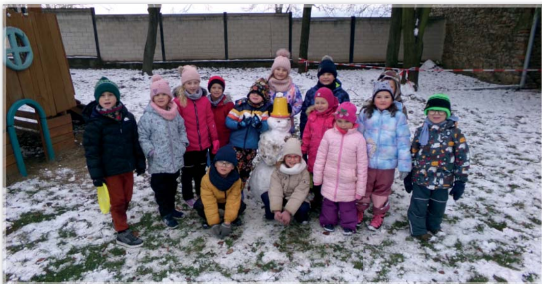
Včeličky na sněhu