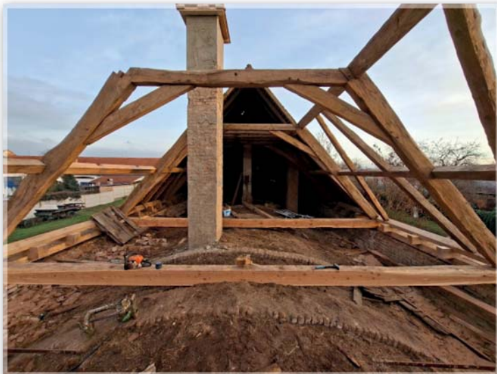
Rekonstrukce střechy bývalého statku

Rekonstrukce střechy zároveň každoročně odčerpává nemalou část finančních prostředků z obecního rozpočtu. To samozřejmě znamená, že některé další investice musí být odloženy v čase.