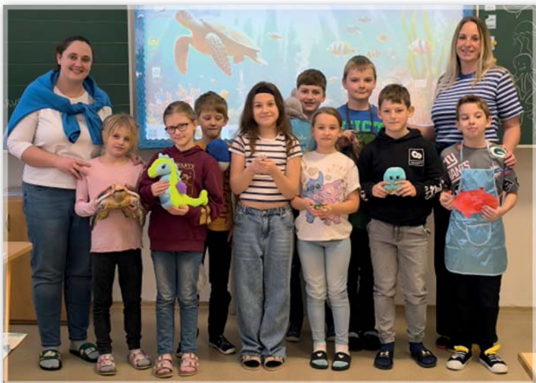
Podmořský svět – 3. třída