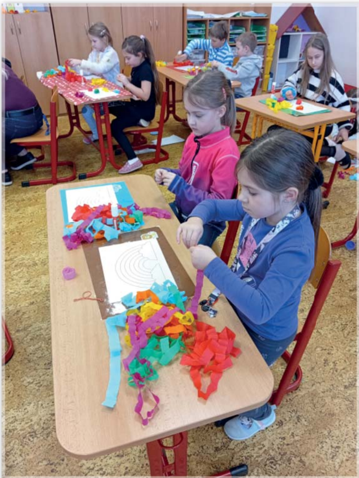
Tvoření ve školní družině

Mimo tyto činnosti často využíváme tělocvičnu a školní zahradu k pohybovým aktivitám. Ve výtvarných a pracovních činnostech jsme využívali týdenní témata, mimoto si děti vyzkoušely i různé ruční práce, jako je háčkování či pletení. Některé děti se do těchto činností zapojovaly a část z nich si tvořila své vlastní hry. Děti podporujeme i v individuálních a kreativních činnostech, kde mohou rozvíjet svoji fantazii. Děti využívají ve ŠD i interak-