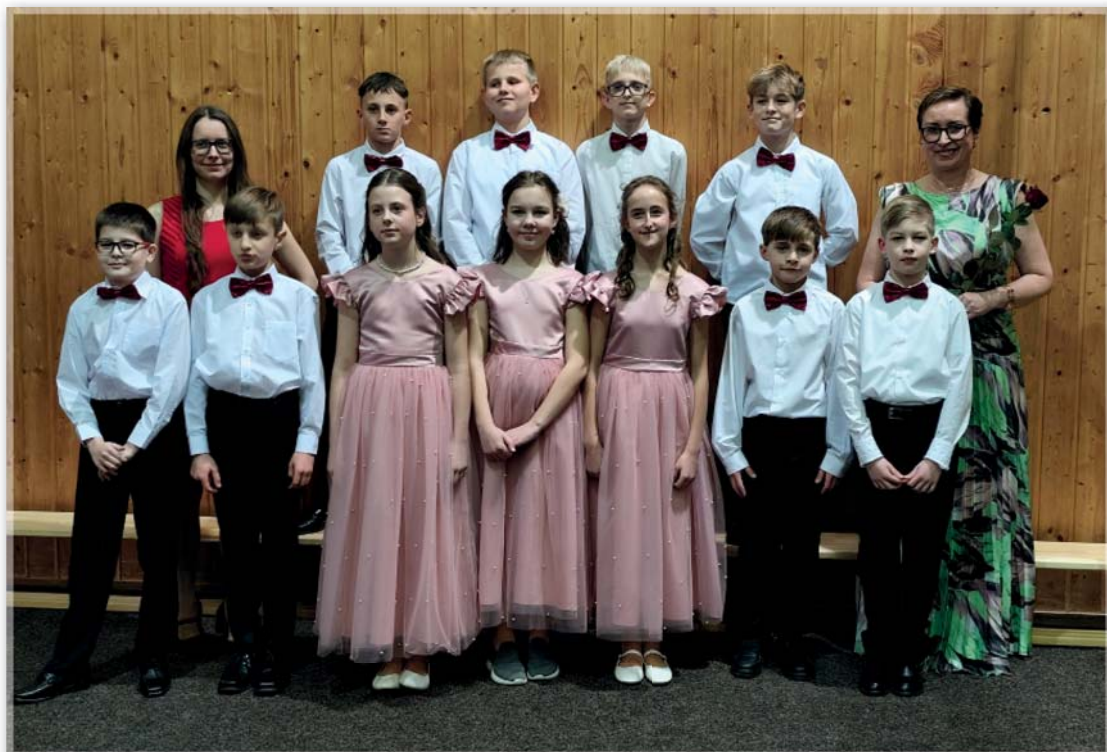
Školní ples – 5. třída