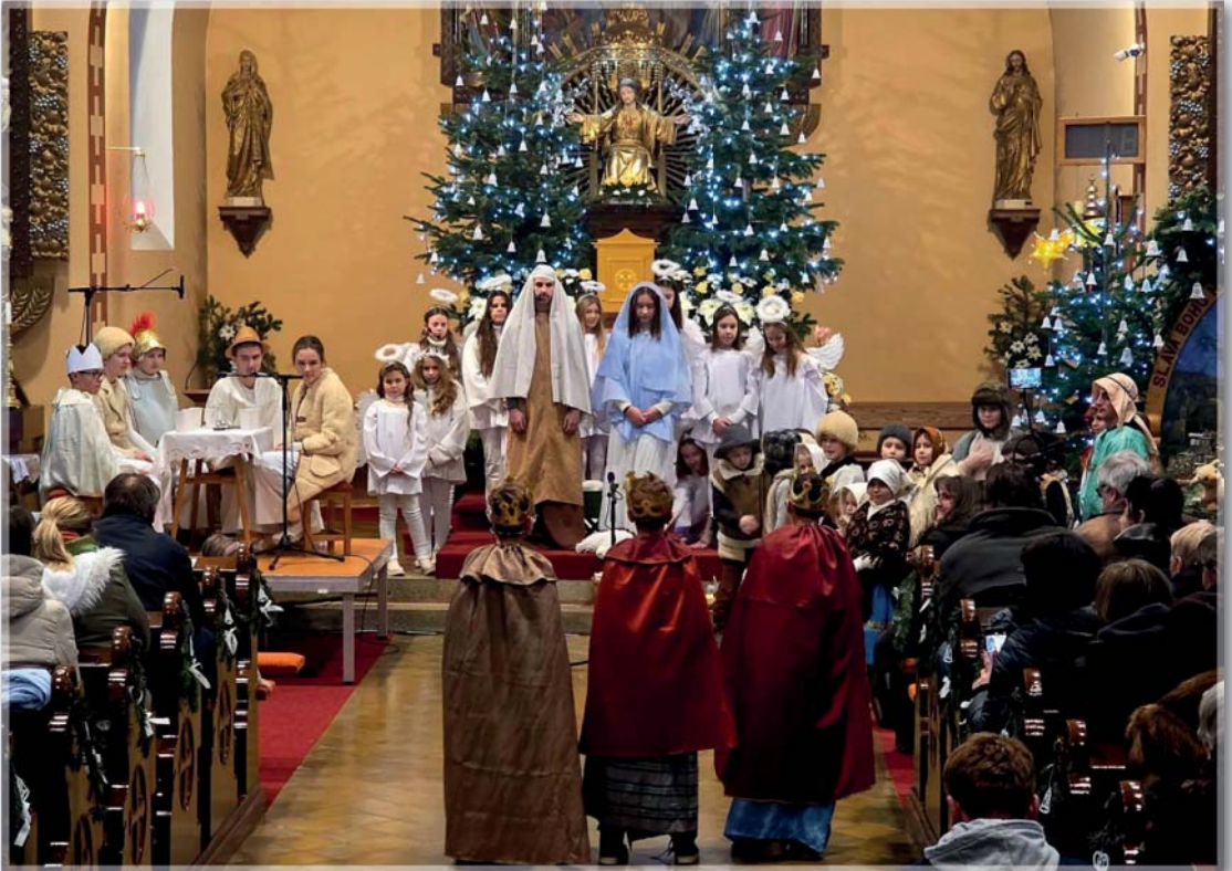
Vánoční pásma dětí u jesliček – 25. 12. 2025