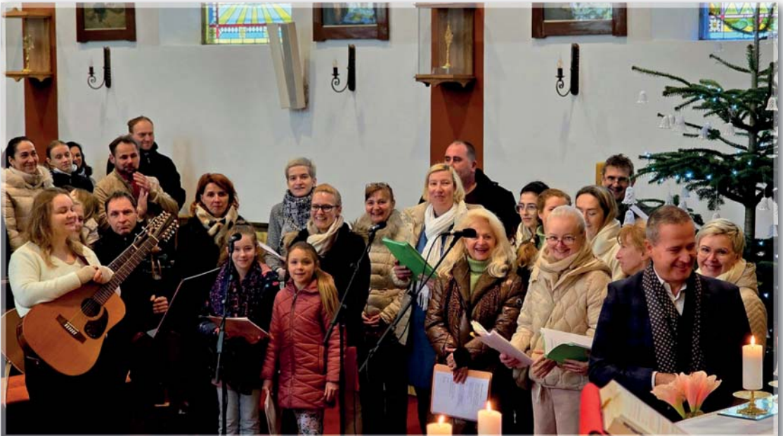
Vánoční bohoslužba na svatého Štěpána – tradičně doprovází radějovská schola