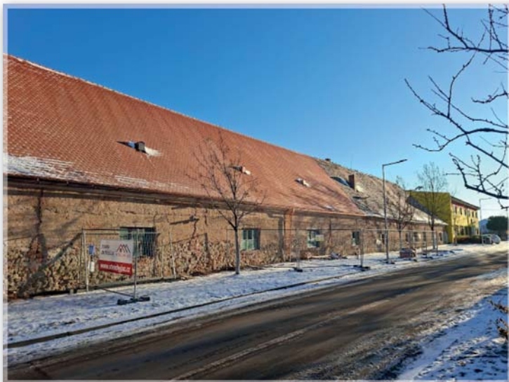
Etapa v roce 2025