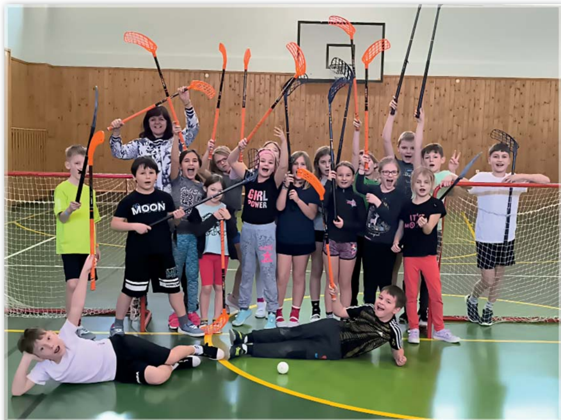
Hokej v TV – 2. a 3. třída