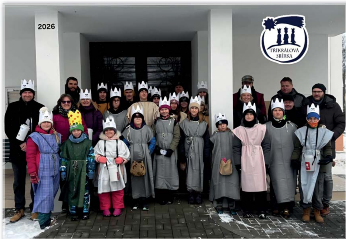
Tříkrálová sbírka 2026