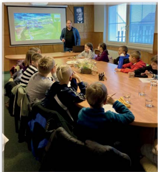
3. třída na Obci