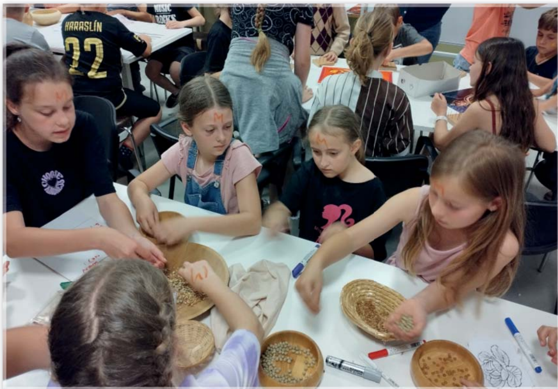
Program v Mikulčičích