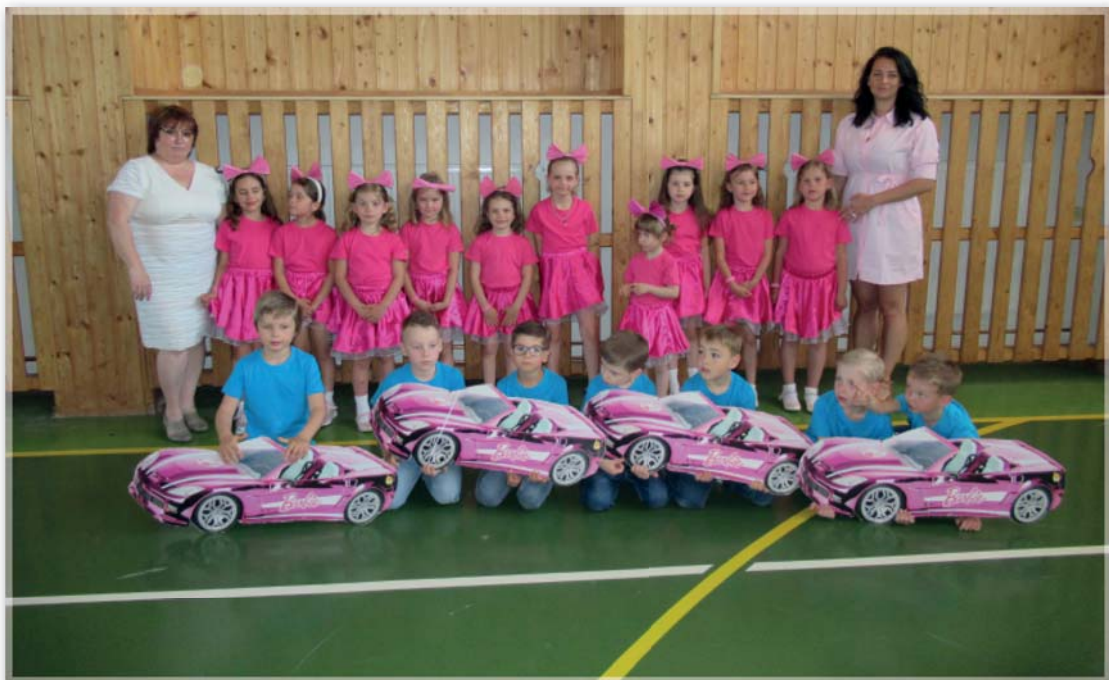
vystoupení pro maminky – Včeličky