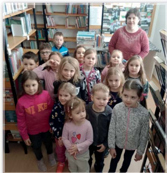
Včeličky v knihovně