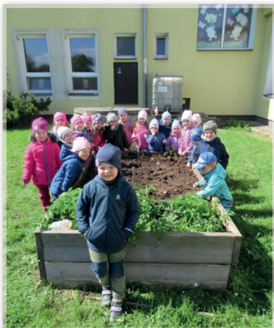
sadba hrášku Berušky