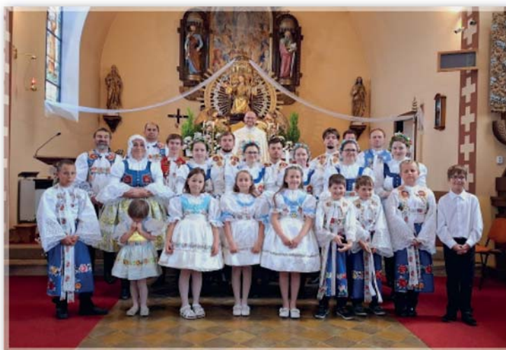
Slavnost Těla a Krve Páně – 26. květen 2024