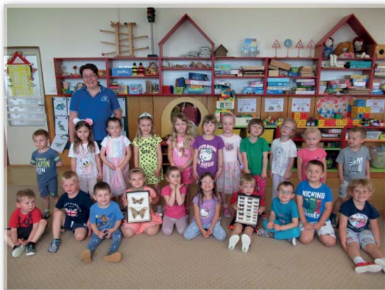
výukový program CHKO – 27. května