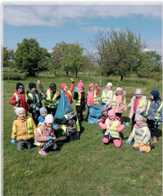
uklízeme obec – Den Země Včeličky