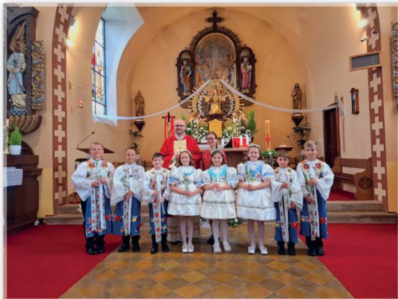
První svatě přijímání - 19. květen 2024