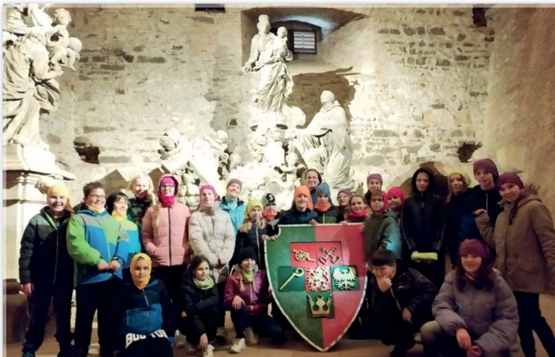
Praha – sál Gorlice