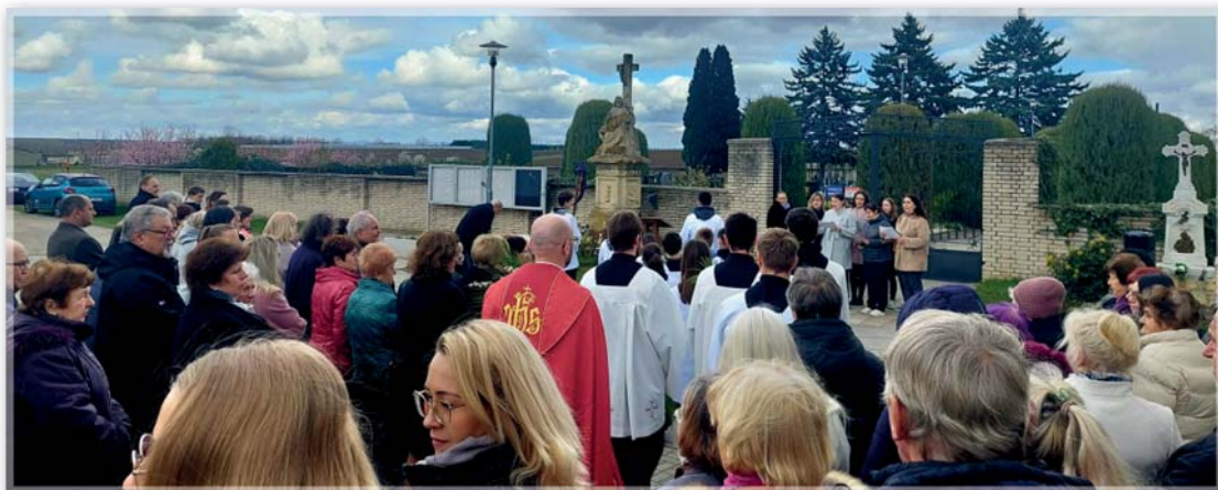
Květná neděle a Zelený čtvrtek