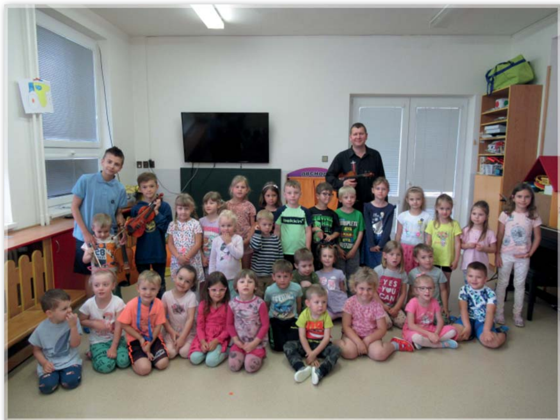
Návštěva houslistů ze ZUŠ ve Strážnici 24. května