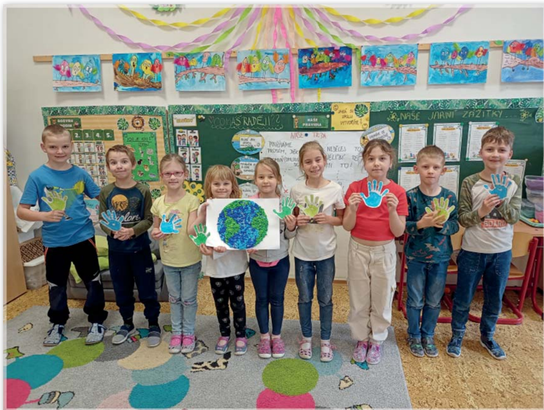
1. třída Den Země