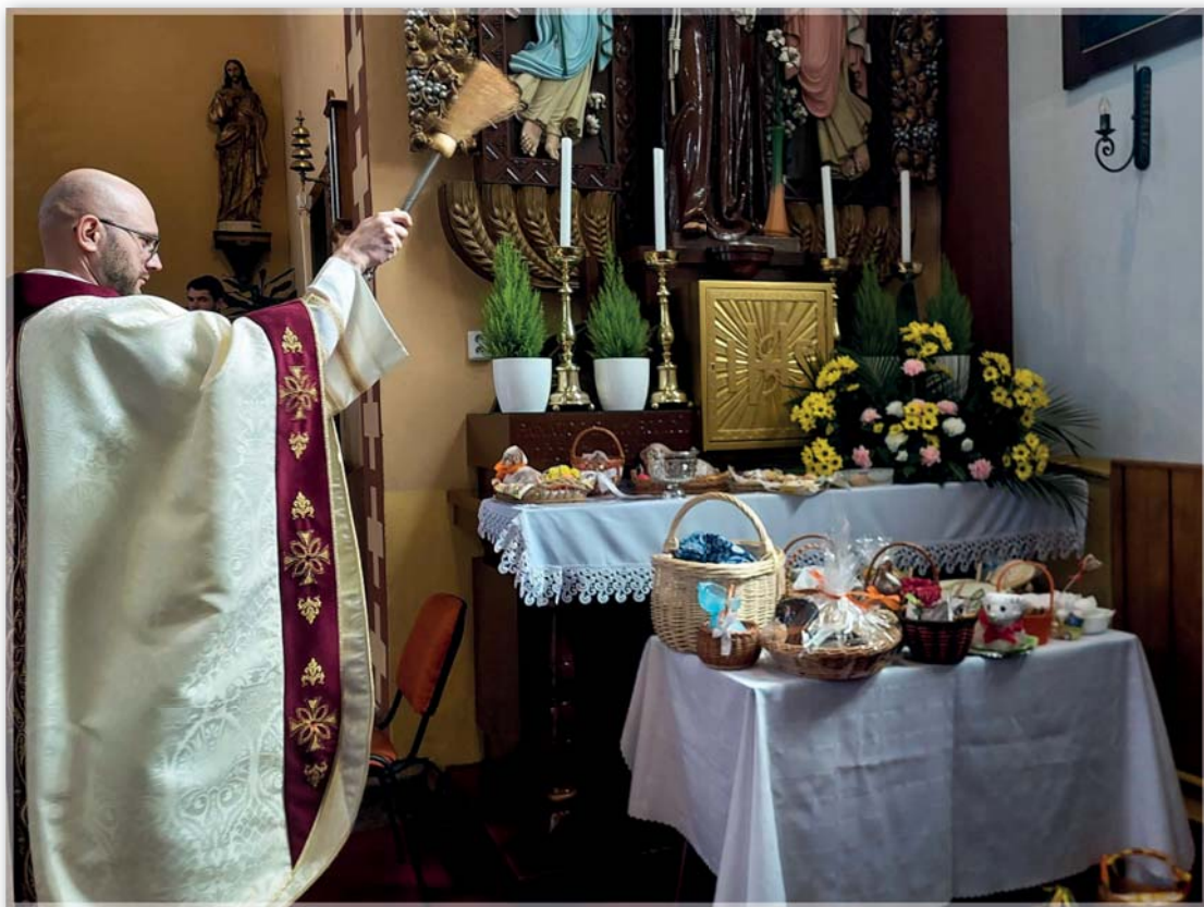
Svěcení pokrmů – Slavnost Zmrtvýchvstání Páně