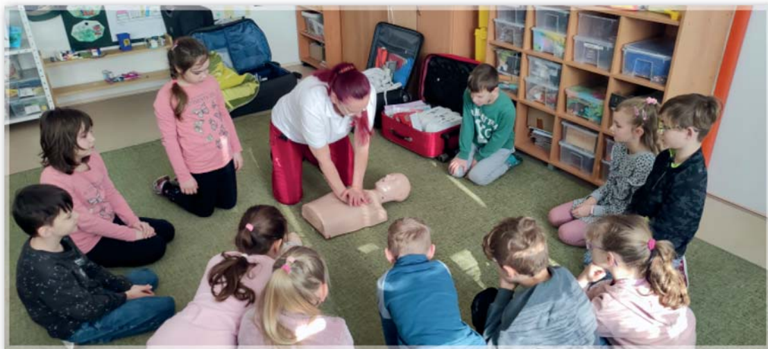
Školení první pomoci