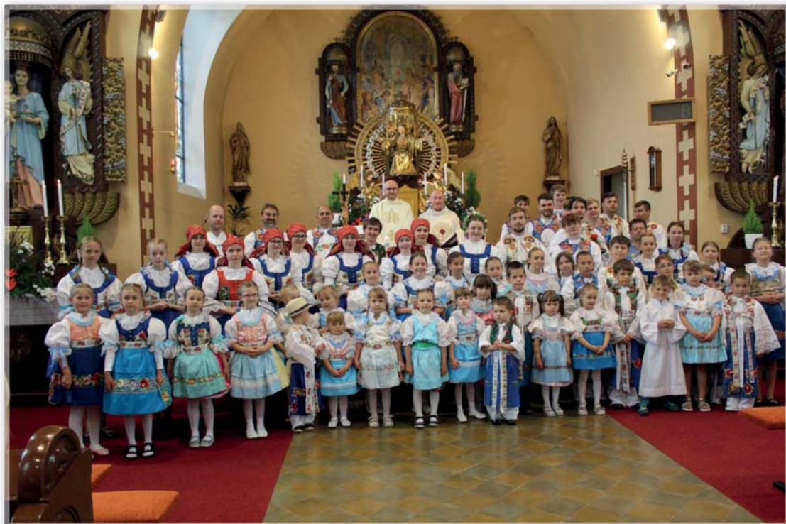
Hodová mše svatá – 1. červen 2024