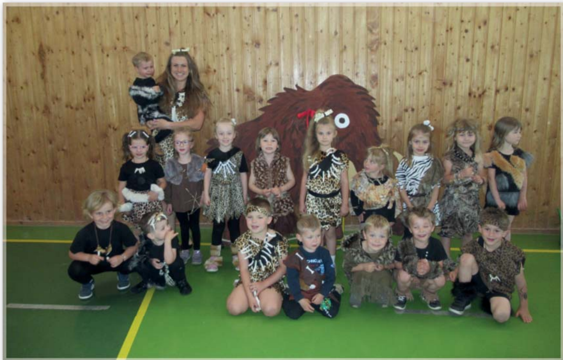
vystoupení pro maminky – Berušky