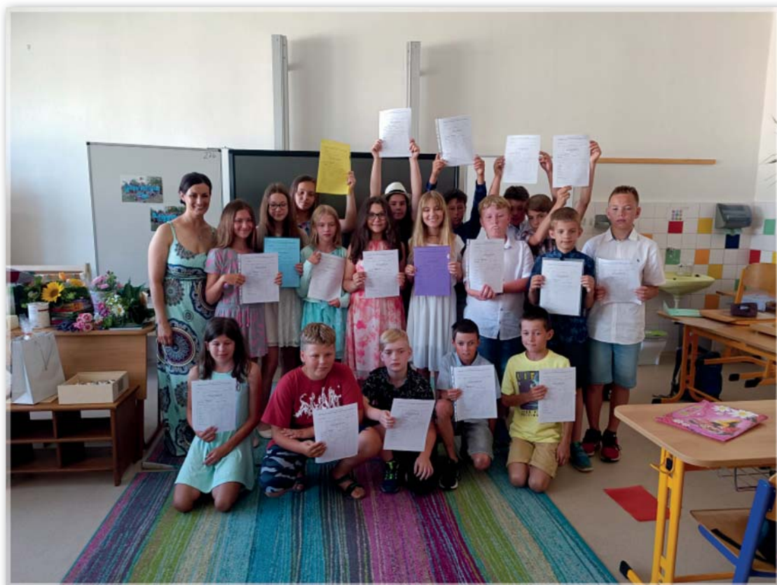
Poslední vysvědčení pátáků v naší ZŠ