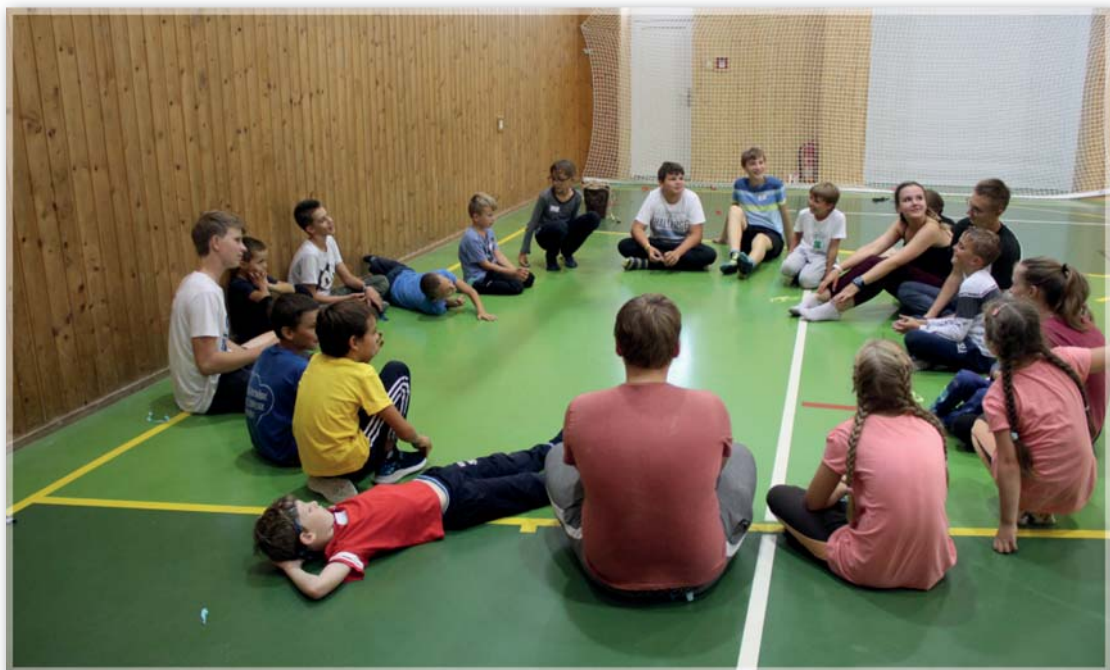
Setkání ministrantů z piaristických farností