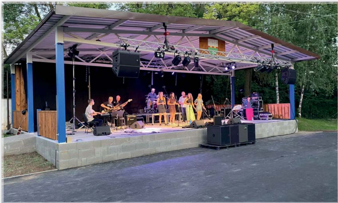
Strážnická kapela Fčeličky