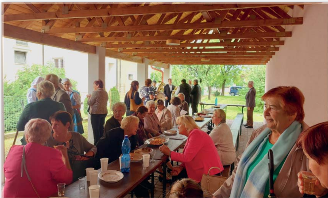
Slavnostní poděkování za úrodu – dožínky – 4. září – posezení na farní zahradě