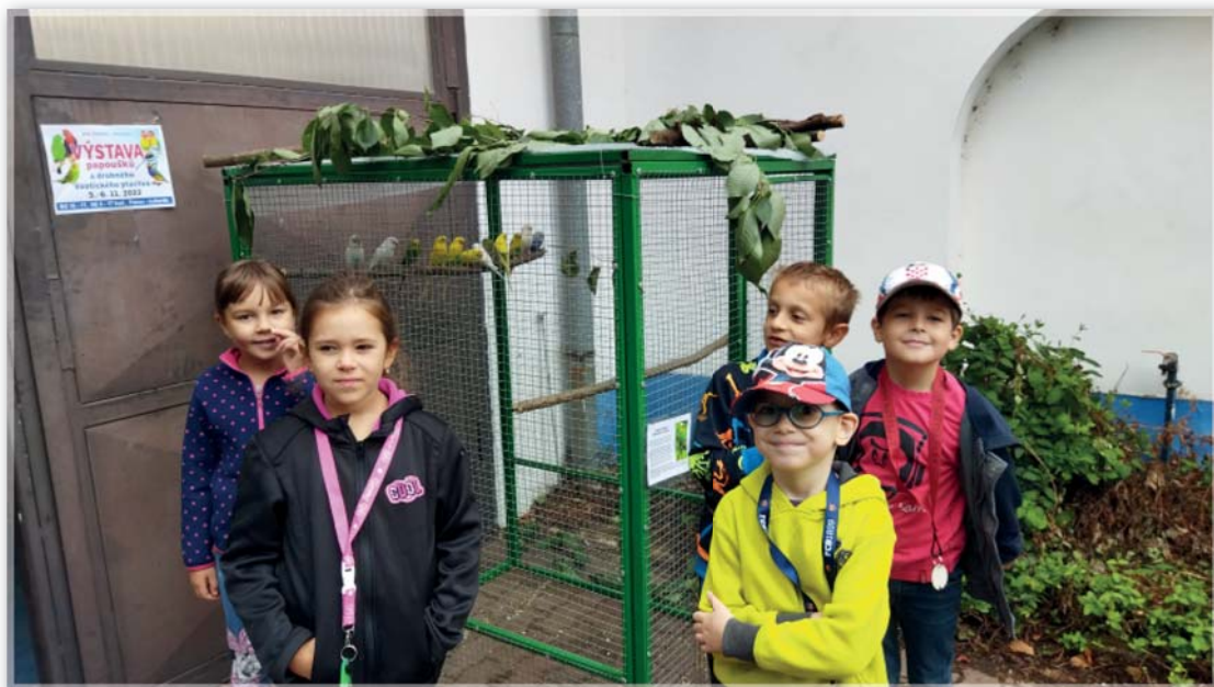
Žáci na výstavě drobného ptactva a zvířectva