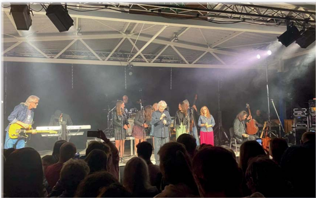
Skupina Bacily a zpěvák Václav Neckář