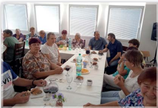
Posezení v Brezové