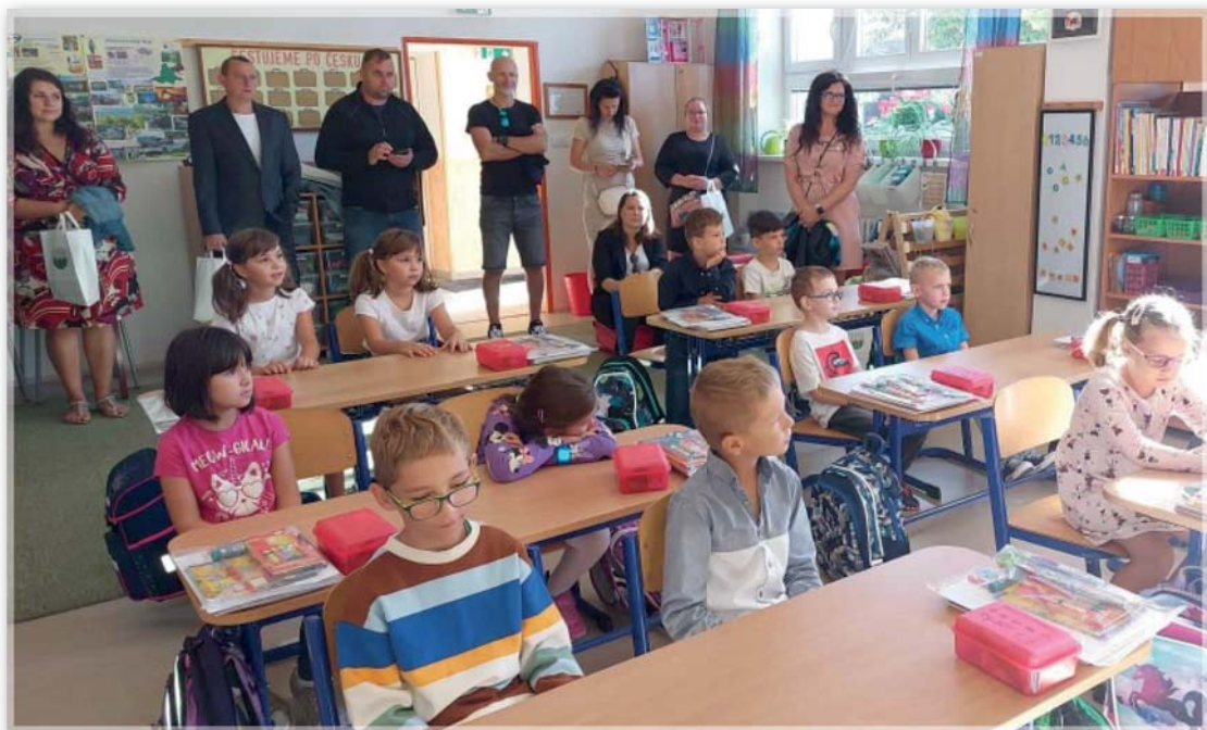
Žáci 1. třídy poprvé ve své třídě