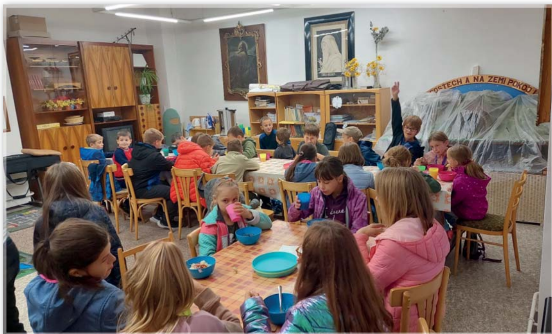
Spaní na faře – 30. září 2022 – večere v přístavbě kostela