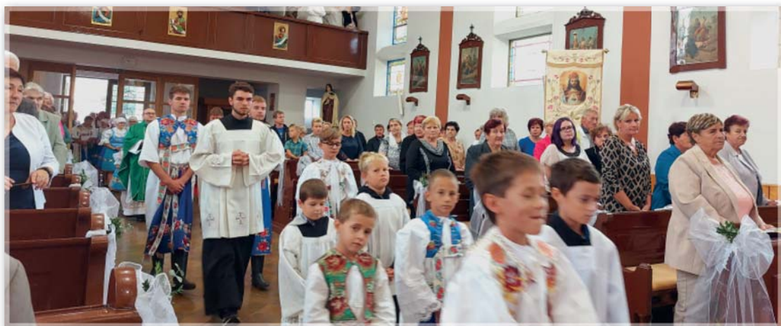
Slavnostní poděkování za úrodu – dožínky – 4. září