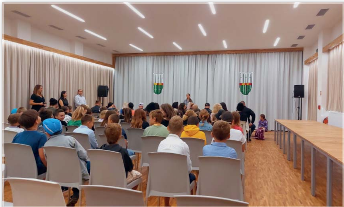
Zahájení školního roku 1. září