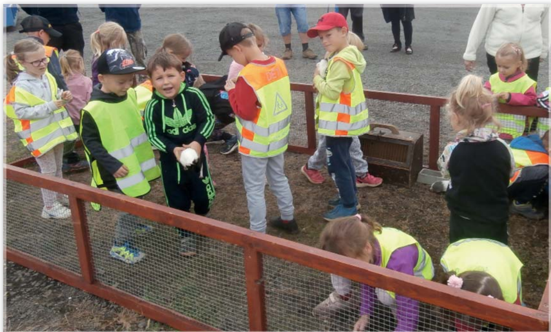
Včeličky na výstavě zvířat