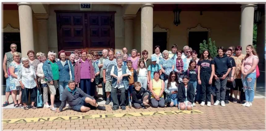
Výlet do Čech pod Kosířem