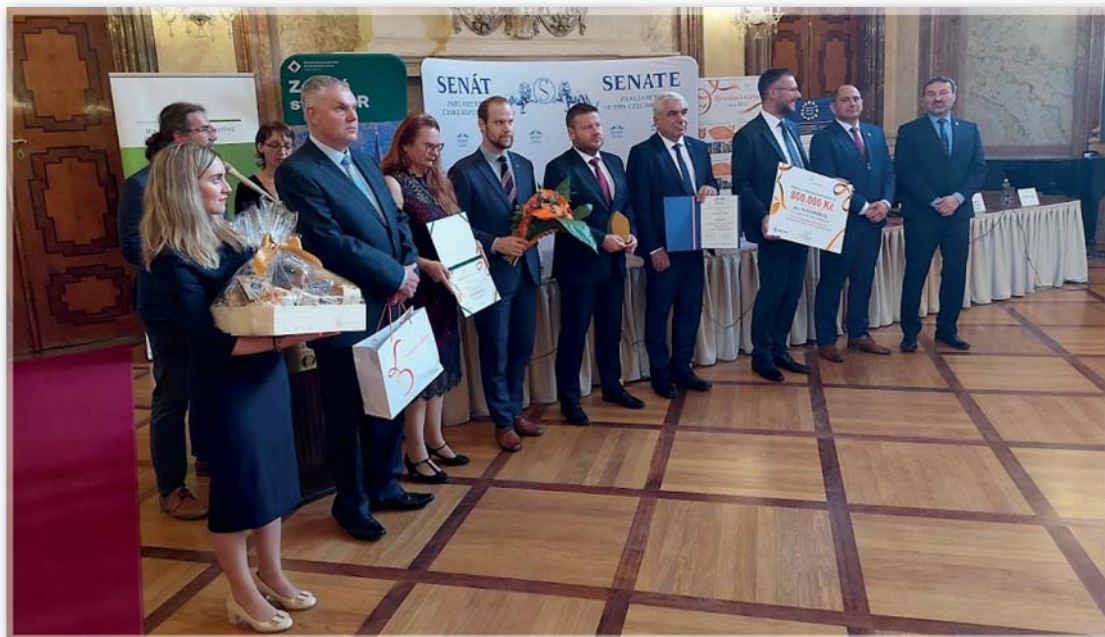
Slavnostní vyhlášení celostátního kola Oranžové stuhy v budově Senátu Parlamentu ČR – 4. října 2022