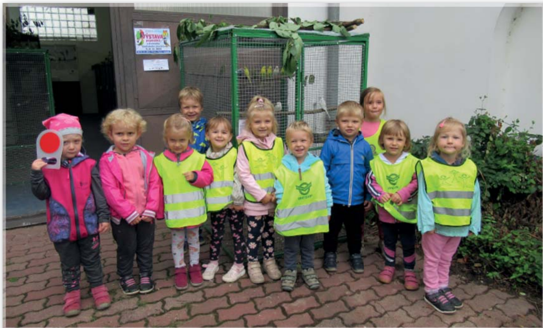
Berušky na výstavě ptactva a zvířectva