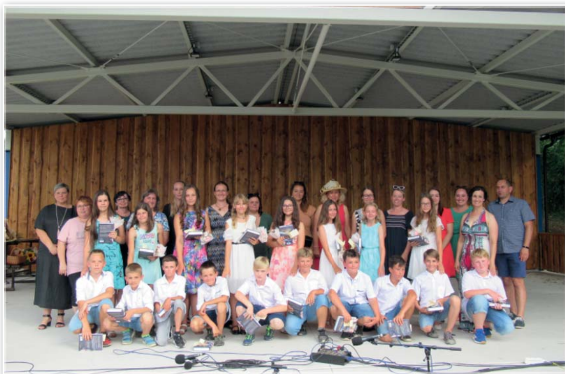
Zaměstnanci školy a odcházející pátáci