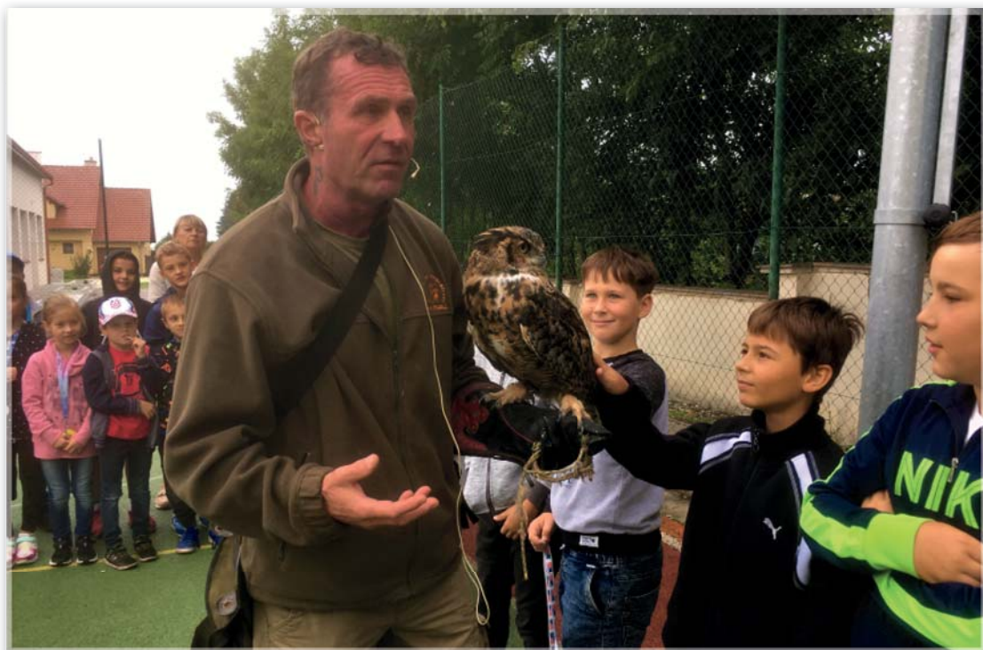
9. září – Den se zvířátky – prezentace živých dravců