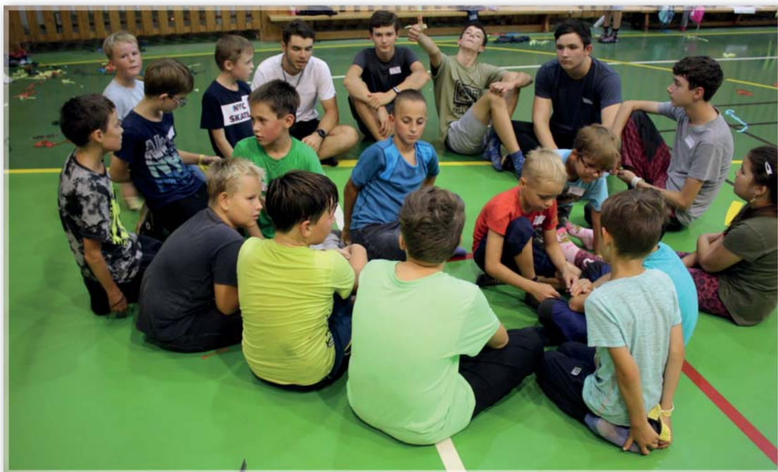
Setkání ministrantů z piaristických farností