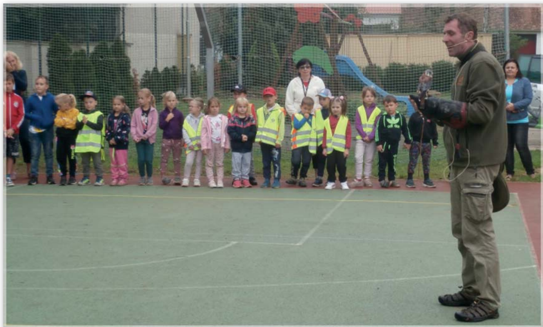
Včeličky na ukázce dravců