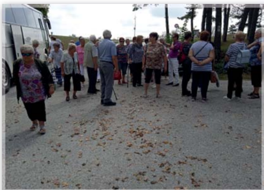
Návštěva na Bradle