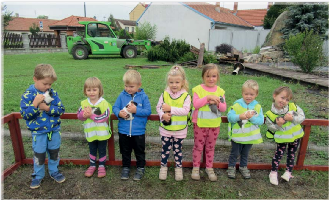
Berušky poznávají morčata