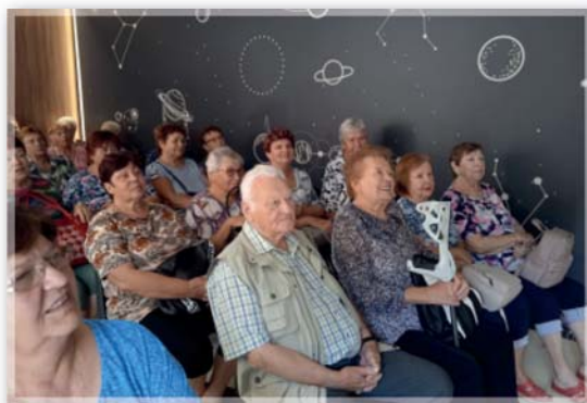
V památníku M. R. Štefánika