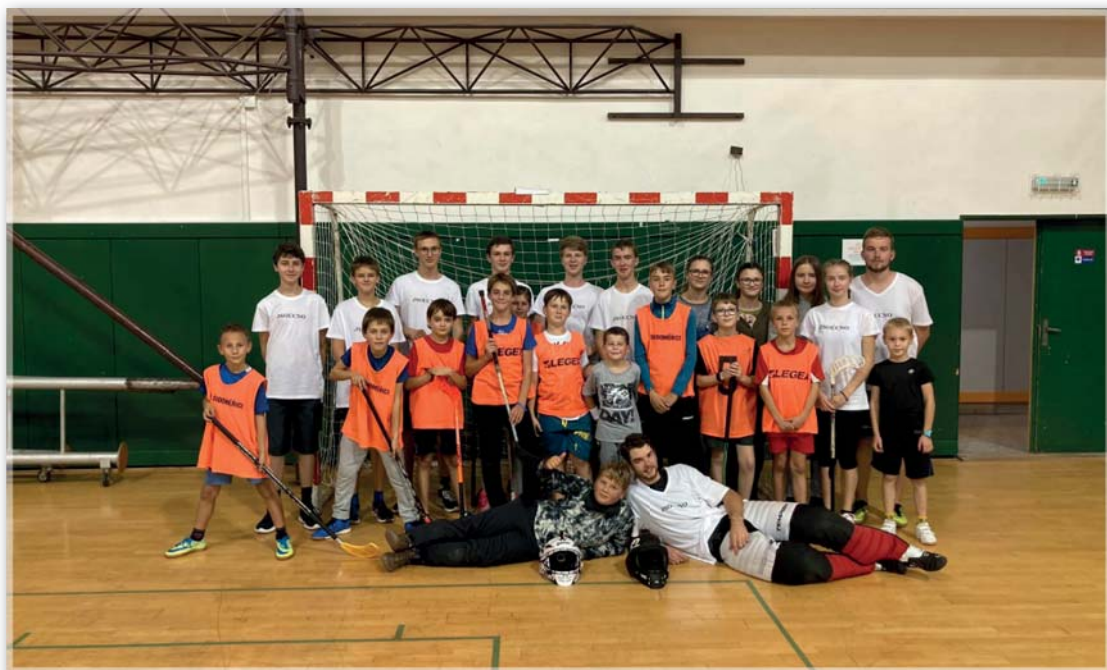
Florbalový turnaj ministrantů v Olomouci – 28. září 2022