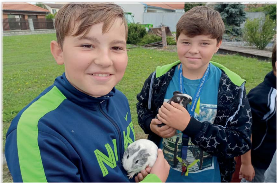
Žáci na výstavě drobného ptactva a zvířectva