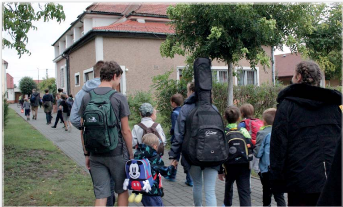
Setkání ministrantů z piaristických farností