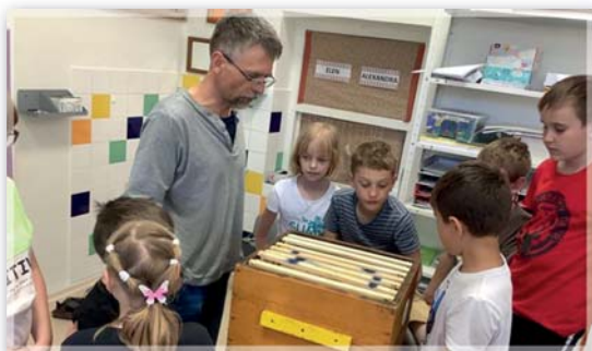
Školní družina - beseda o včelách