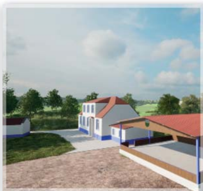
Rekonstrukce areálu ve Starém potoku