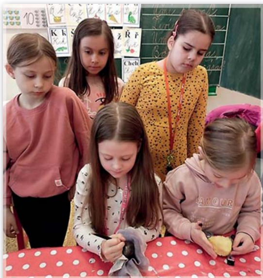
Školní družina – vyškrobování kraslic