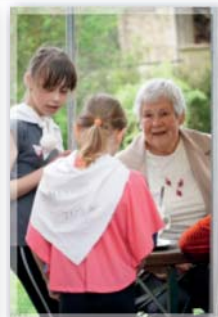
Misijní kavárna a oslava Dne maminek