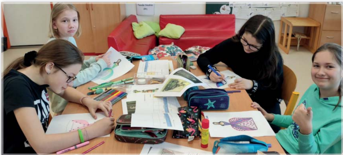
Centra aktivit - První světová válka a první republika (5. ročník)