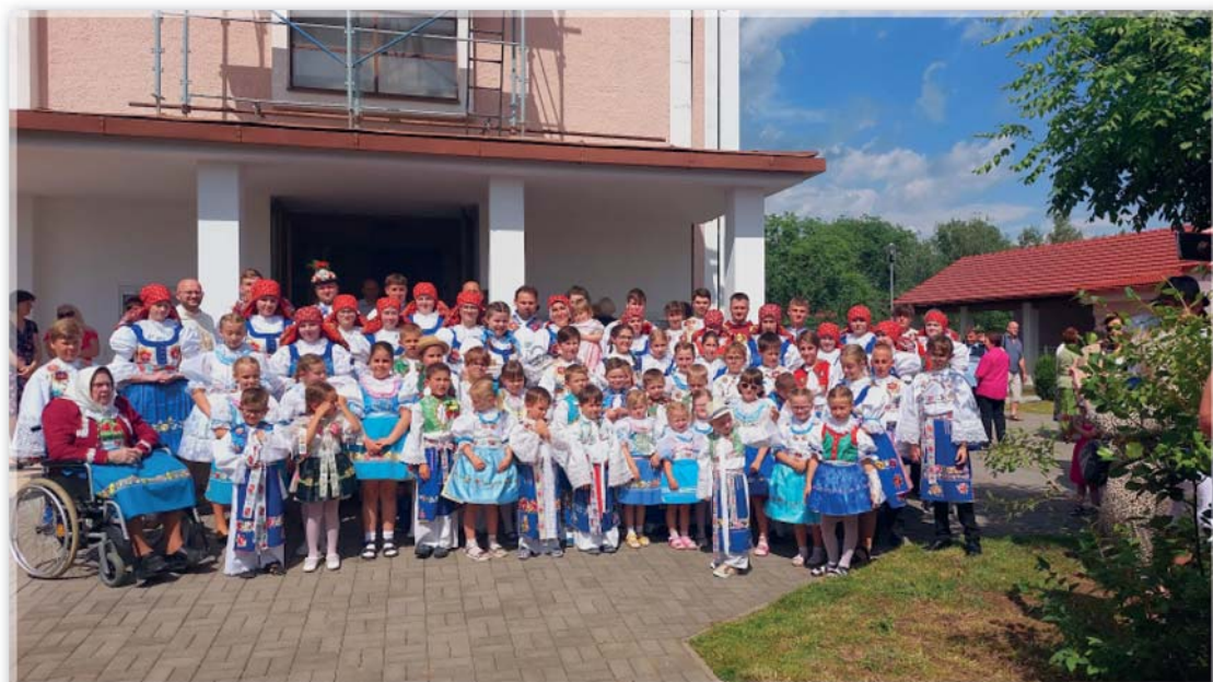
Hodová mše svatá 2022