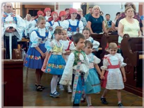
Hodová mše svatá