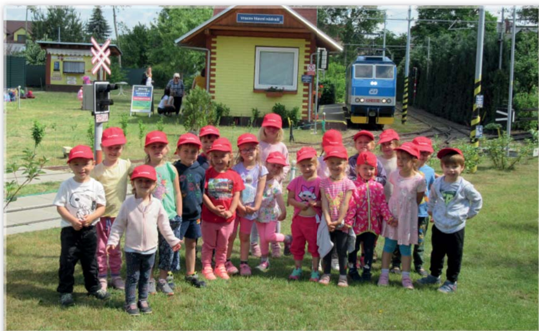
Výlet Železnice 600 – Berušky