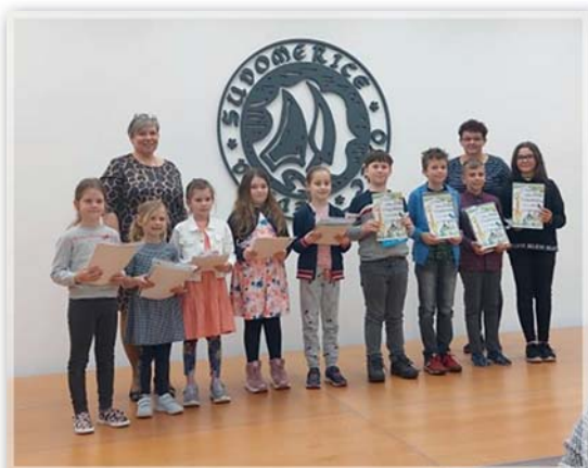
Recitační soutěž mezi ZŠ Petrov a ZŠ Sudoměřice