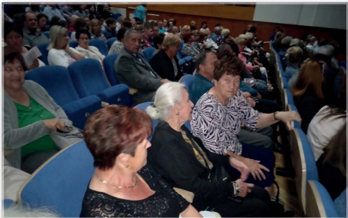
představení 28. května – Svatba na klíč