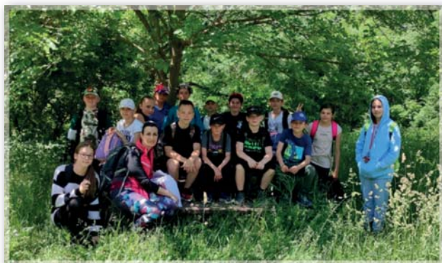
Pěší túra na Mlýny – 5. ročník