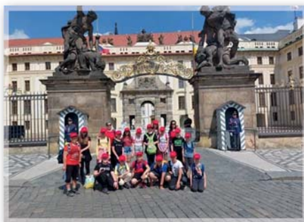
Projekt Občan – poznáváme hlavní město Prahu – 5. ročník