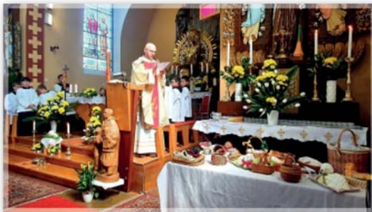
Svěcení velikonočních pokrmů