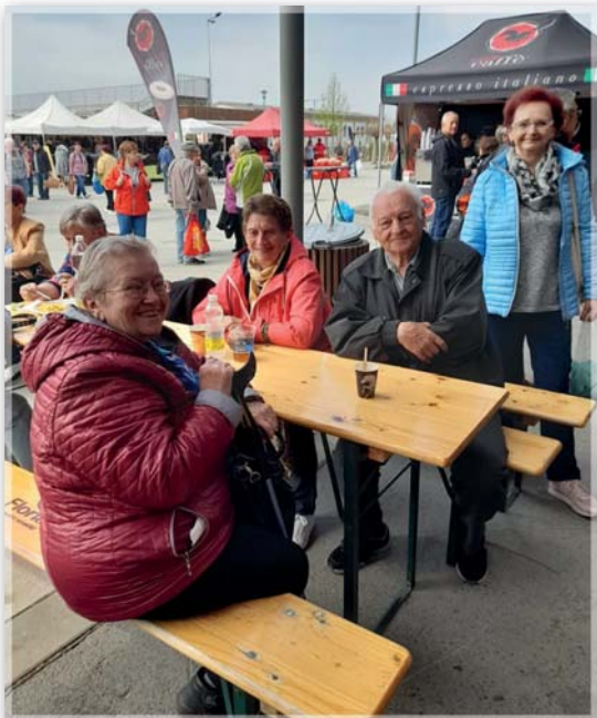
Výstava Floria v Kroměříži