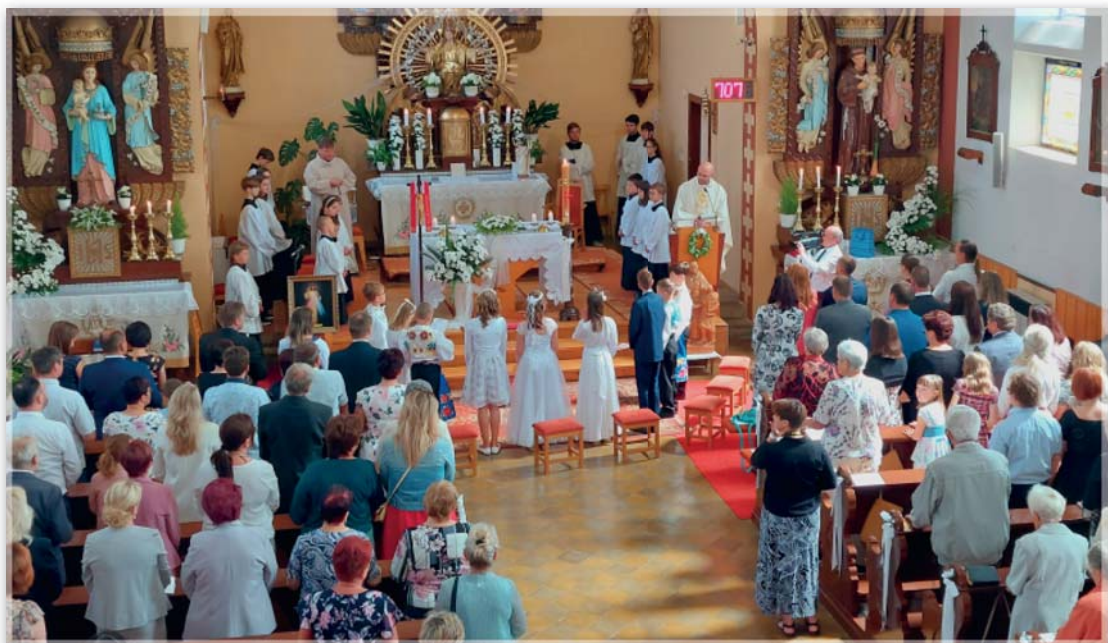
1. sv. přijímání