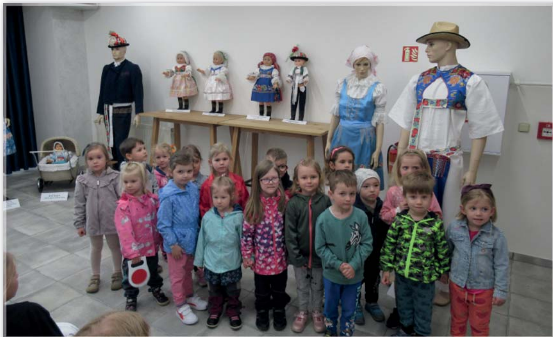
Výstava krojů Berušky