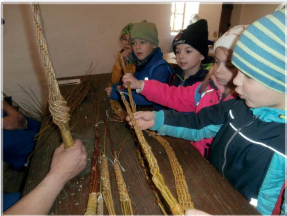
Návštěva ve strážnickém skanzenu