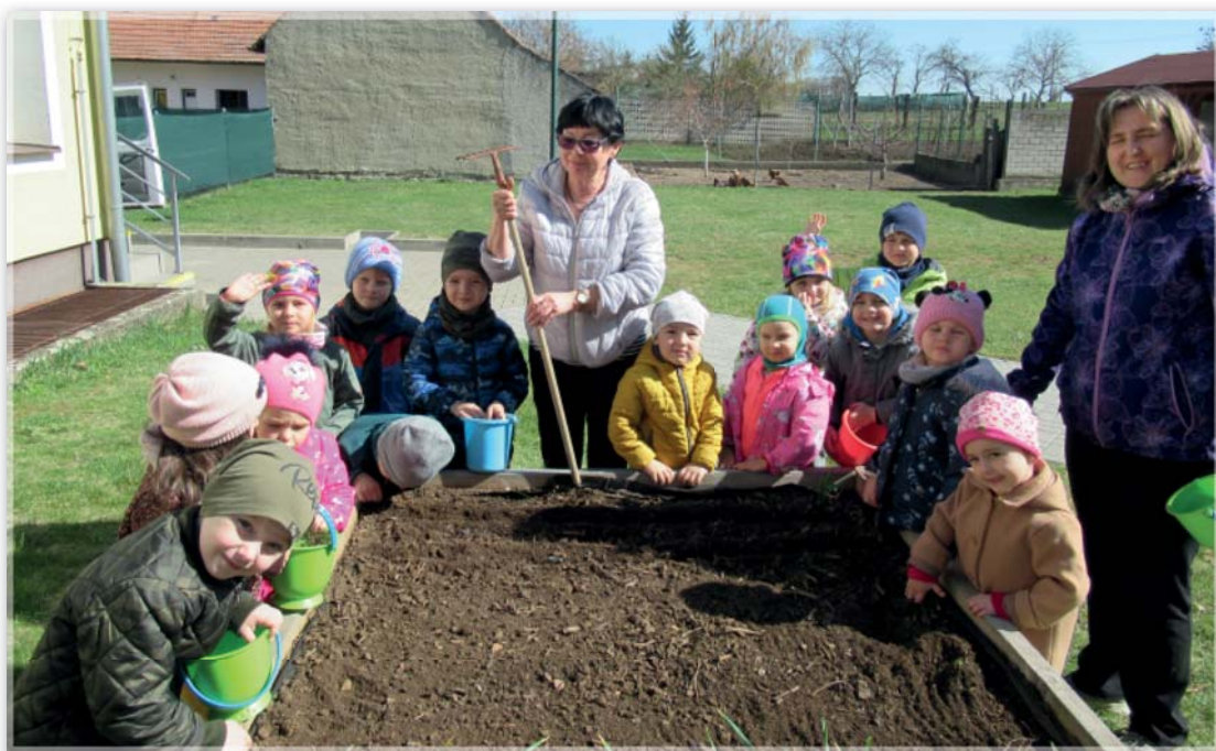
Sázení hrášku a pana Brambory