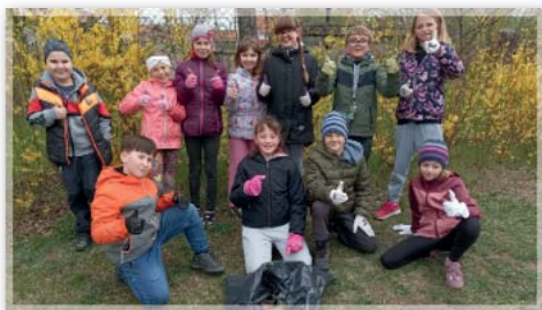
Den Země - 3. ročník