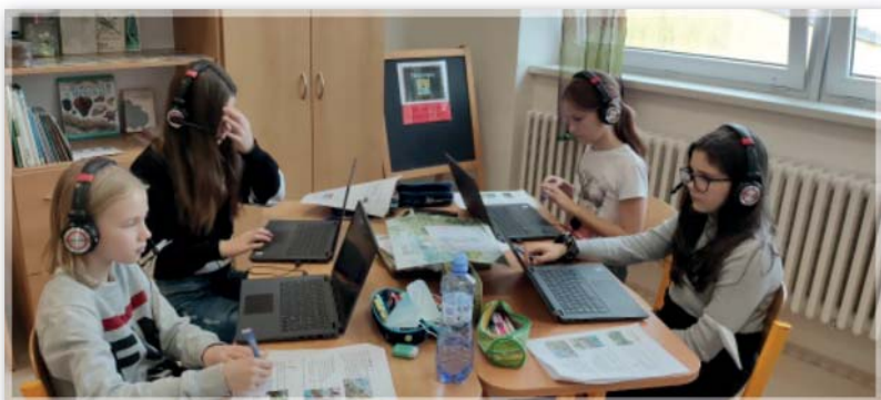
Centra aktivit – Podnebné pásy (5. ročník)