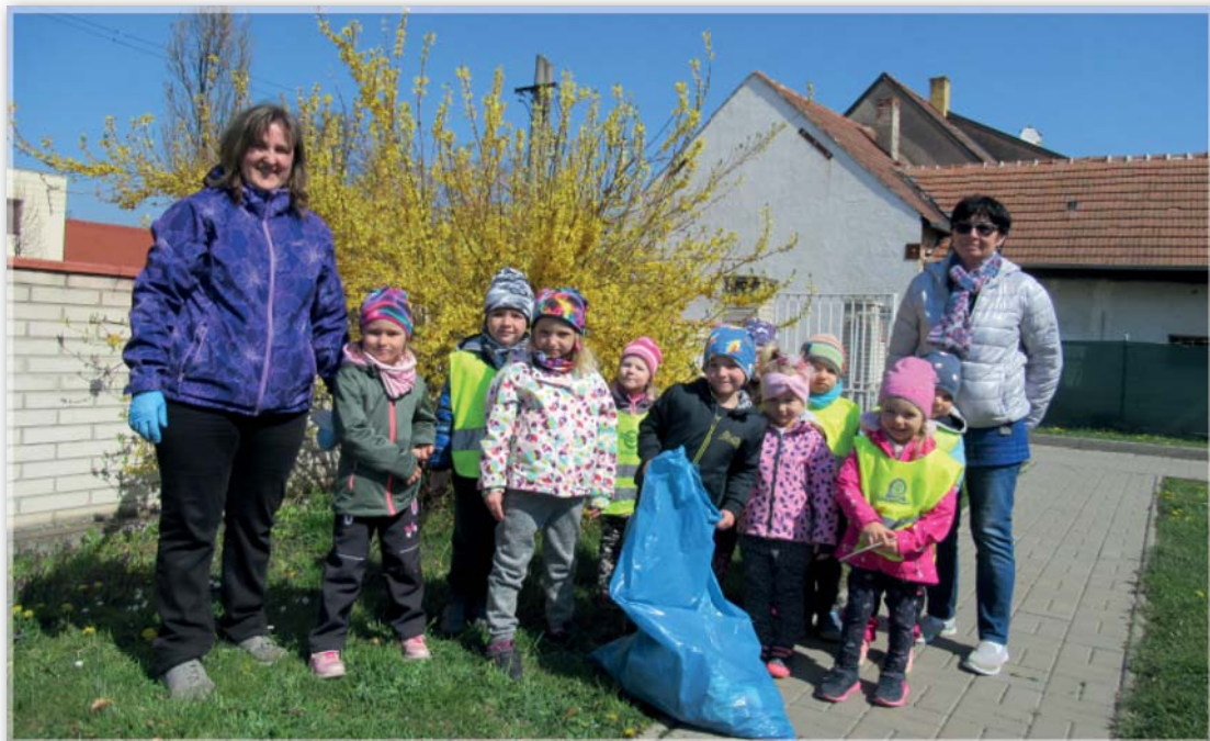
Den Země - Berušky