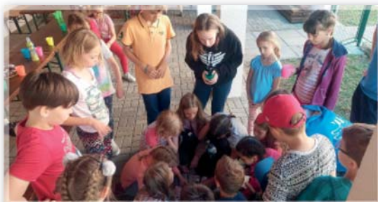
Spaní pro děti na faře - 10. června 2022