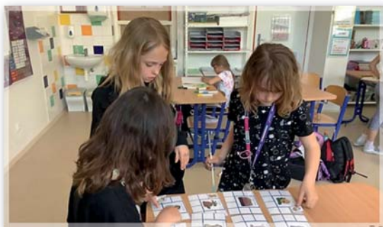
Školní družina – ekologický program