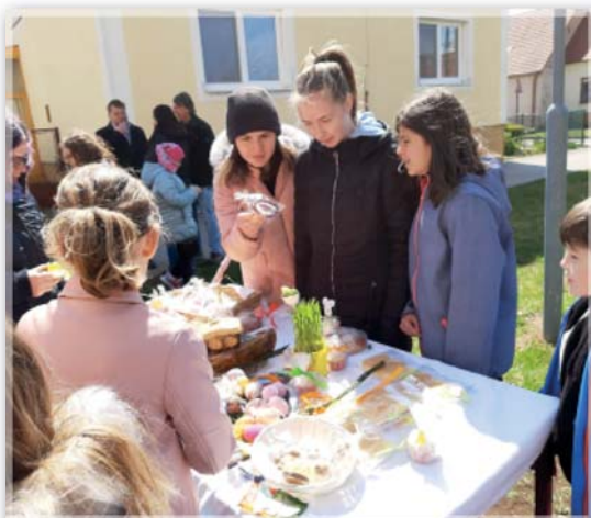
Velikonoční misijní jarmark