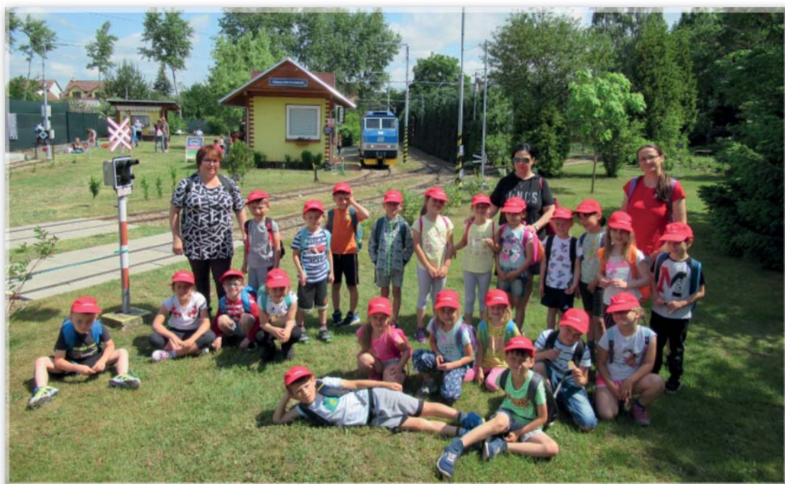
Výlet Železnice 600 - Včeličky