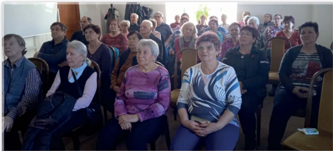
Přednáška 22. března