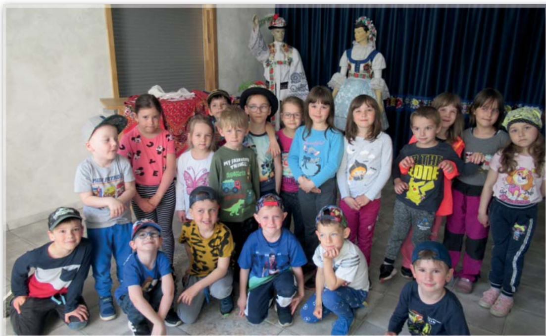
Výstava krojů Včeličky