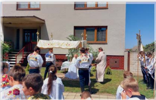
Slavnost Těla a Krve Páně - Boží Tělo, neděle 19. června 2022