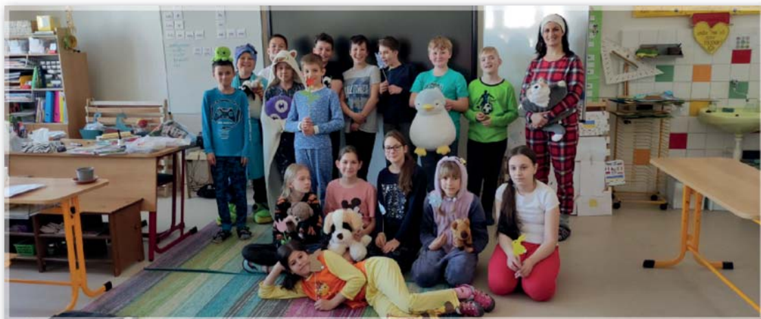
Pyžamový den – 5. ročník