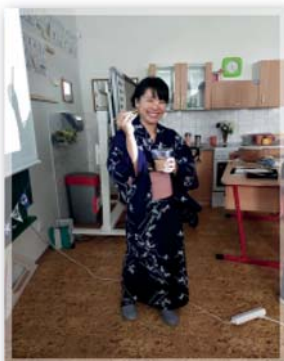
Projektový den EVROPA A SVĚT NÁS ZAJÍMÁ – téma JAPONSKÁ KULTURA