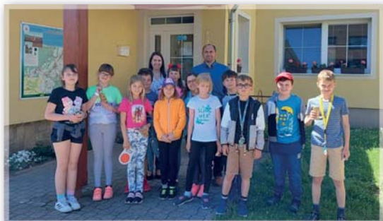
Projekt „Obec a sudoměřický kraj“ – 3. ročník