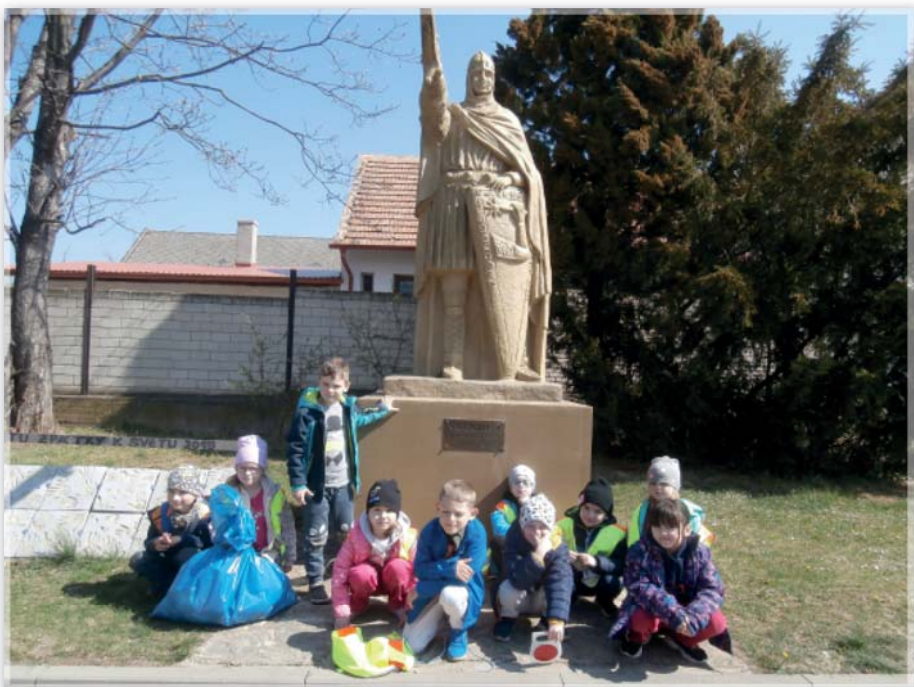
Den Země - Včeličky