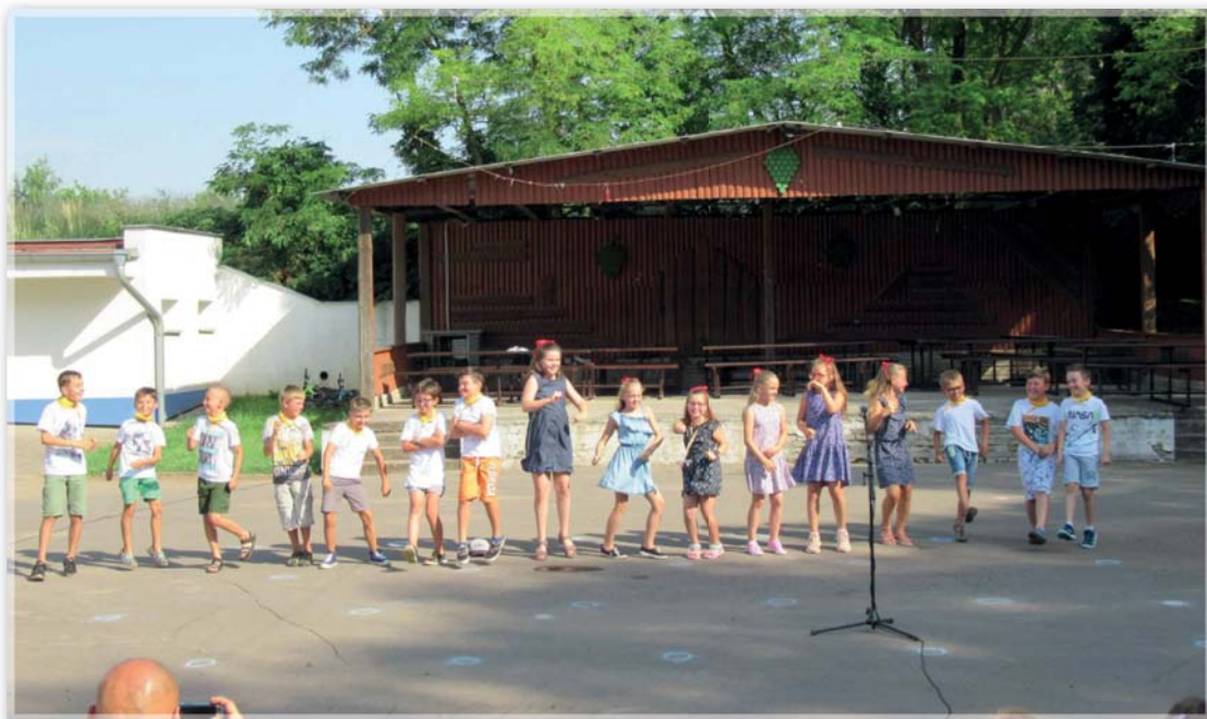
Rozloučení s předškoláky a páťáky – 29. 6. 2021 – 3. ročník