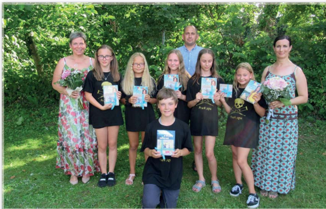
Rozloučení s předškoláky a pátáky – 29. 6. 2021 – 5. ročník