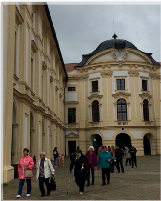
Slavkov u Brna – 31. červenec 2021