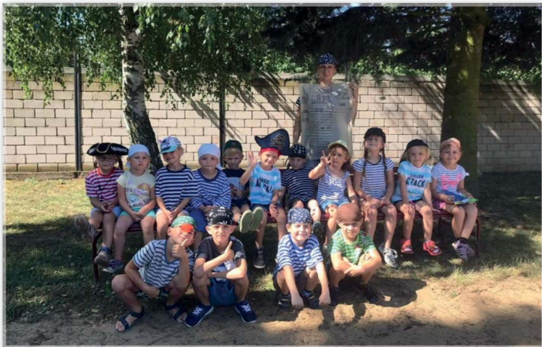
Prázdninový program v MŠ - Piráti