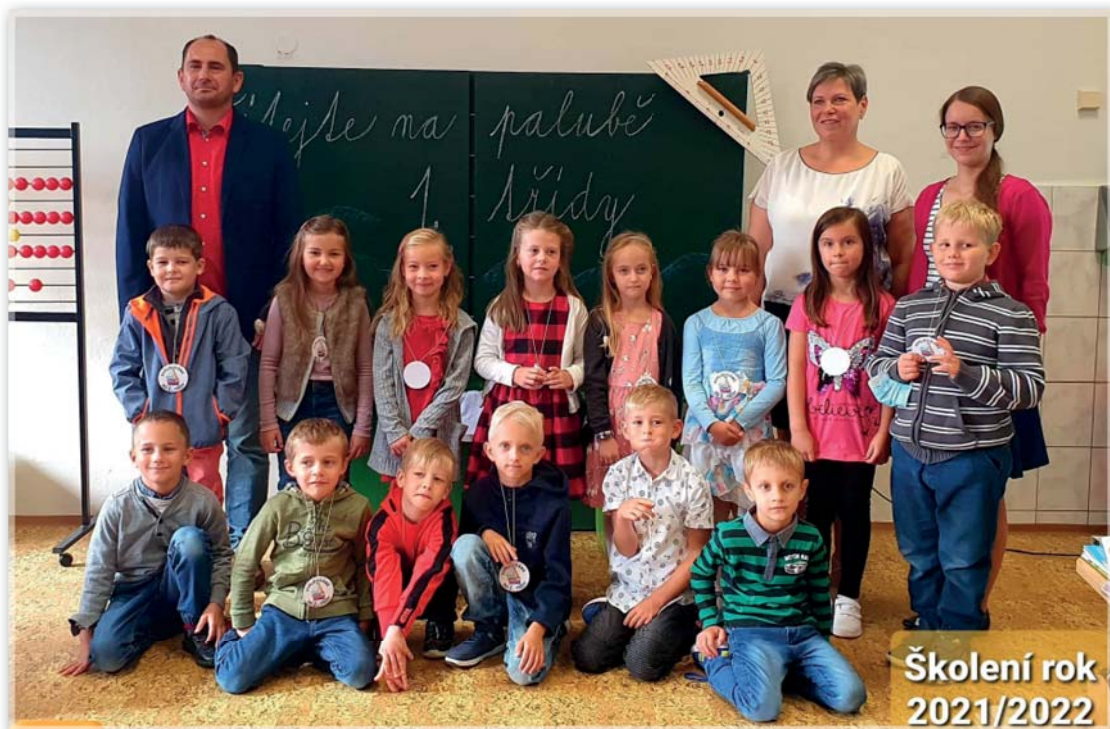
Žáci první třídy – začátek školního roku