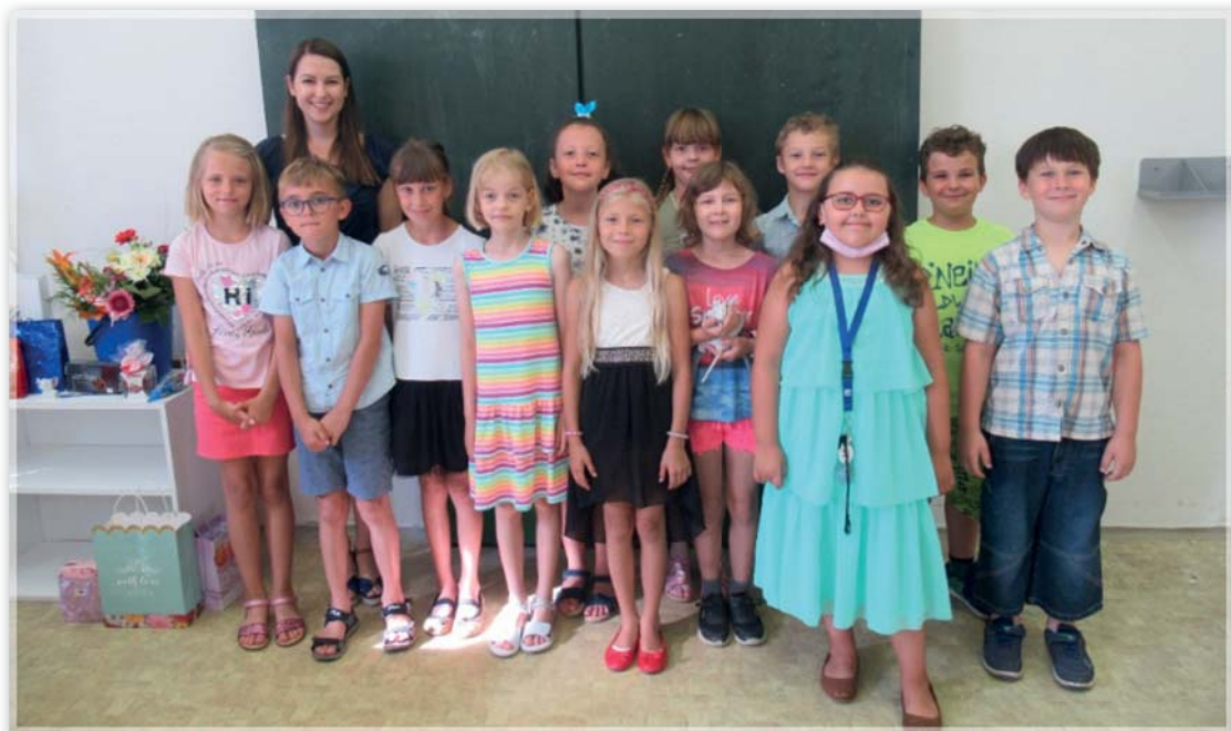
Vysvědčení 2. ročník