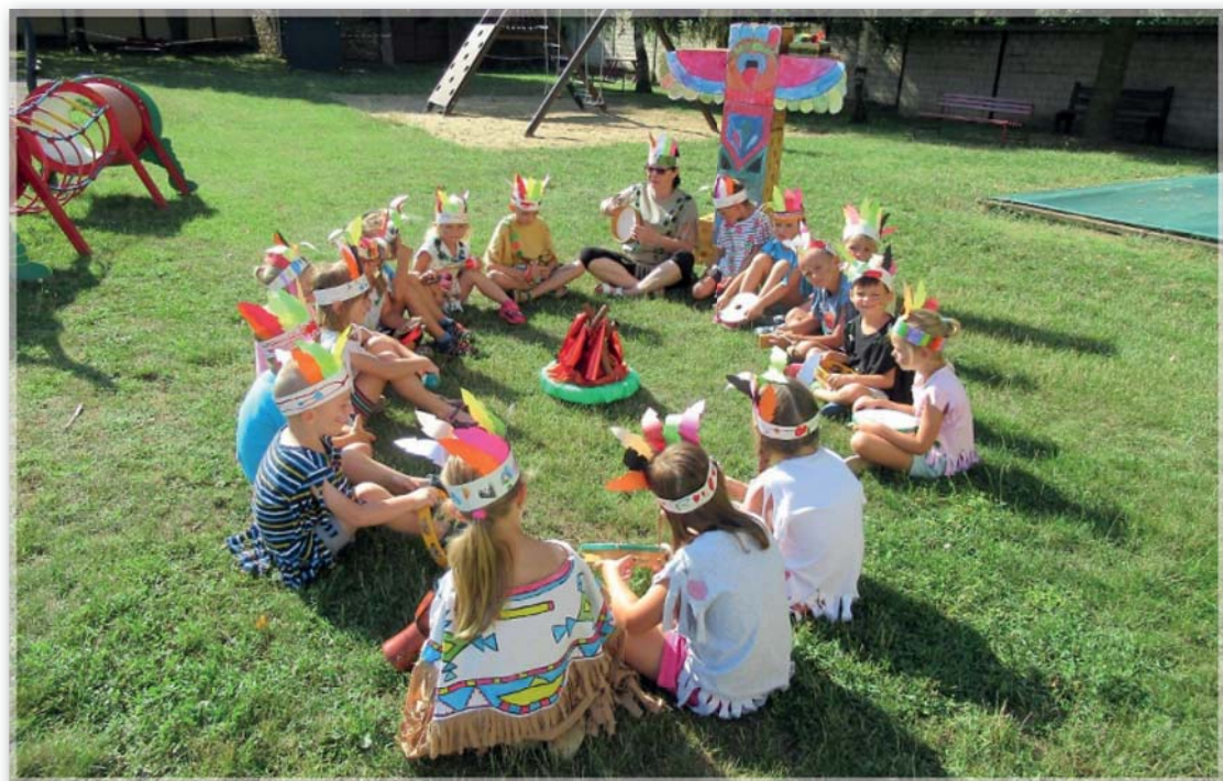
Prázdninový program v MŠ - Indiáni