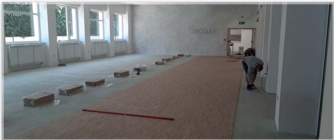
Kontrolní den v nové přístavbě tělocvičny