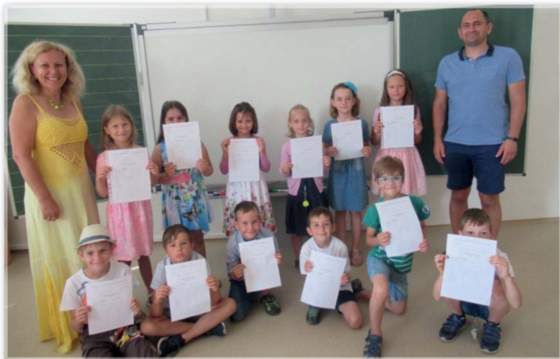
Vysvědčení 1. ročník