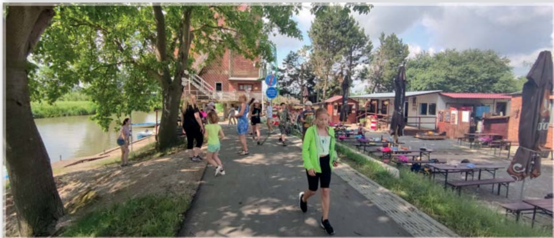
Výlet na Výklopník – červen 2021