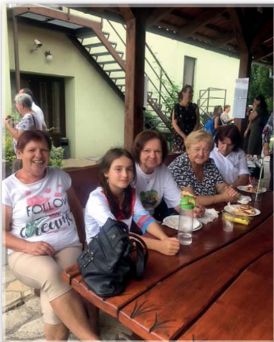
Návštěva Dinoparku – 15. červenec 2021