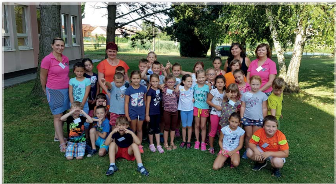
Příměstský tábor Tornádo