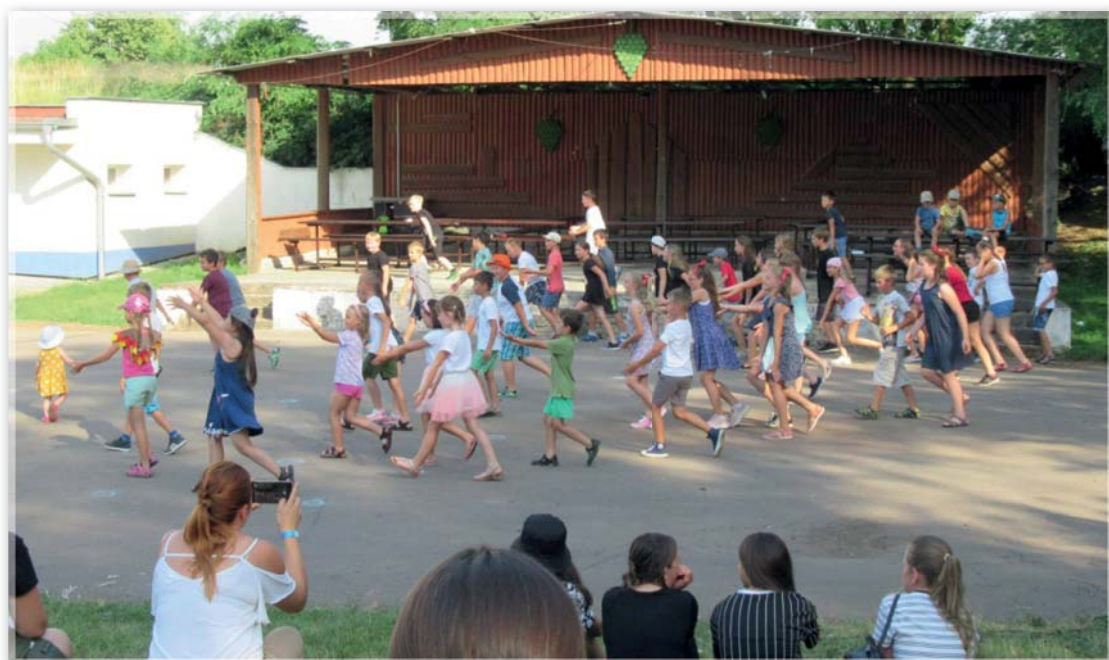
Rozloučení s předškoláky a pátáky – 29. 6. 2021 – tanec Jerusalema