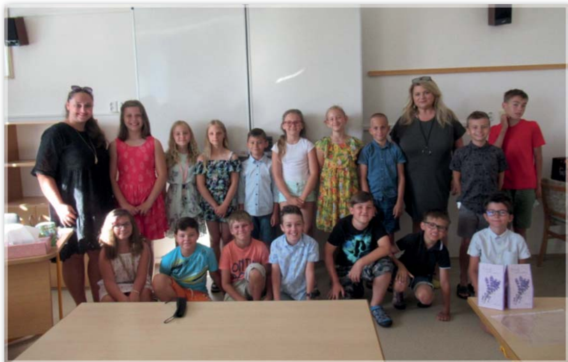
Vysvědčení 3. ročník