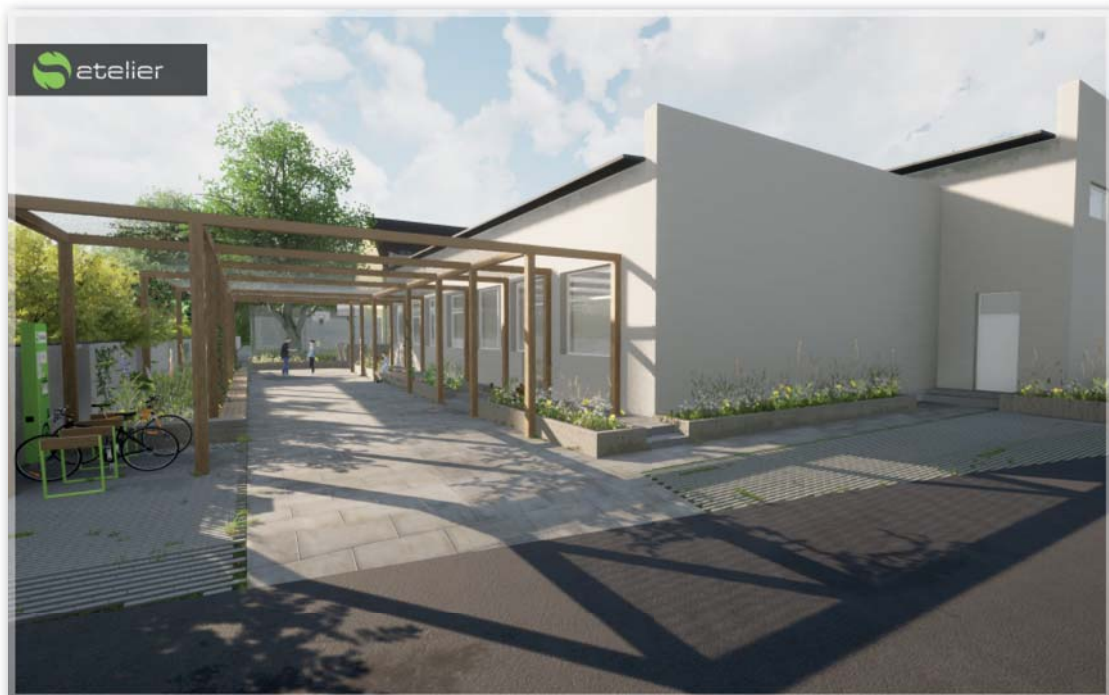
Budoucí venkovní prostory u tělocvičny