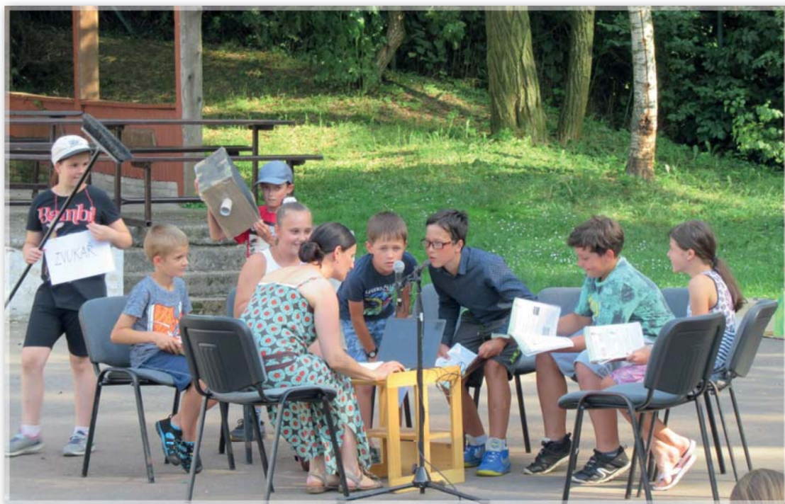
Rozloučení s předškoláky a páťáky – 29. 6. 2021 – 4. ročník