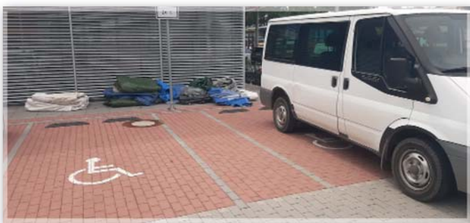
Dovezené plachty jako pomoc pro postižené tornádem v červnu