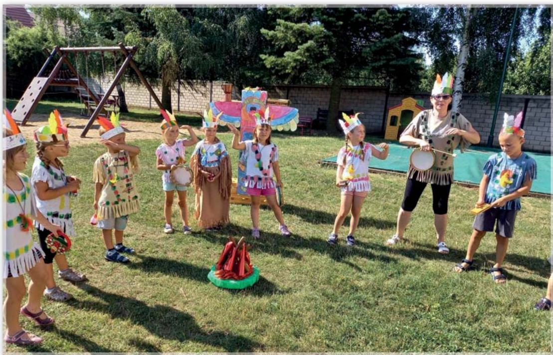
Prázdninový program v MŠ - Indiáni