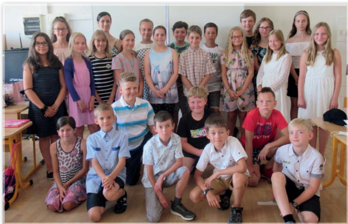
Vysvědčení 4. a 5. ročník