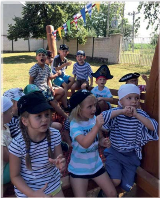
Prázdninový program v MŠ - Piráti