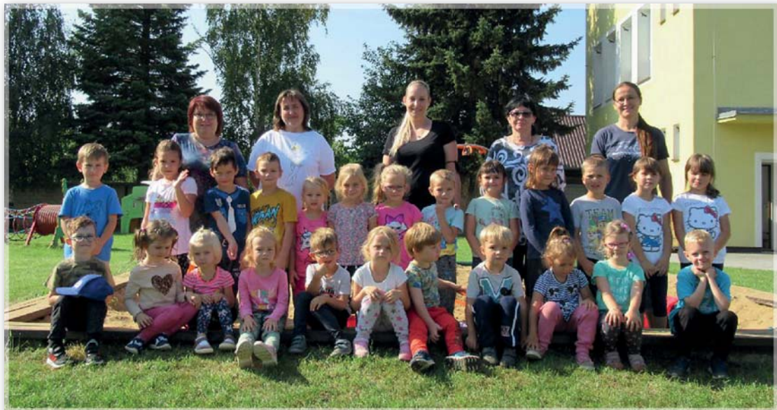
Mateřská školka – zahájení školního roku