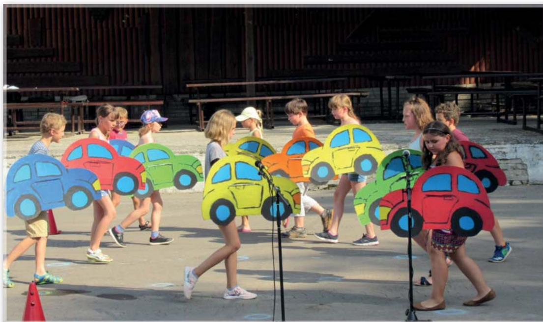
Rozloučení s předškoláky a pátáky – 29. 6. 2021 – 2. ročník