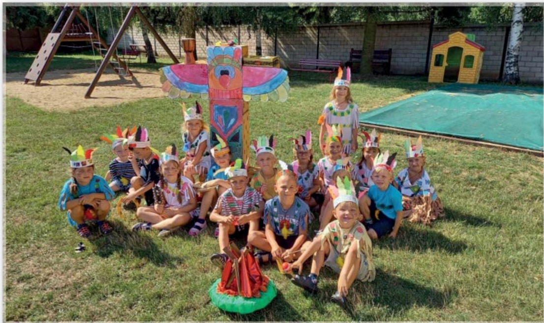
Prázdninový program v MŠ - Indiáni