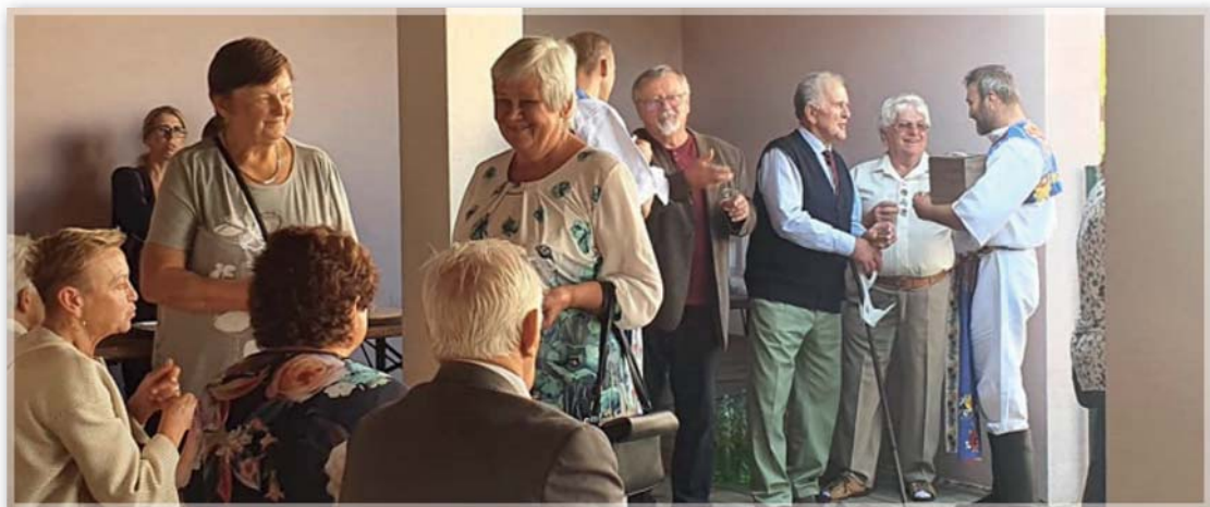
Slavnostní posvěcení nového společenského centra na farní zahradě – 5. 9. 2021