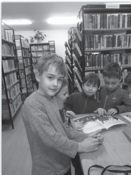
Návštěva místní knihovny