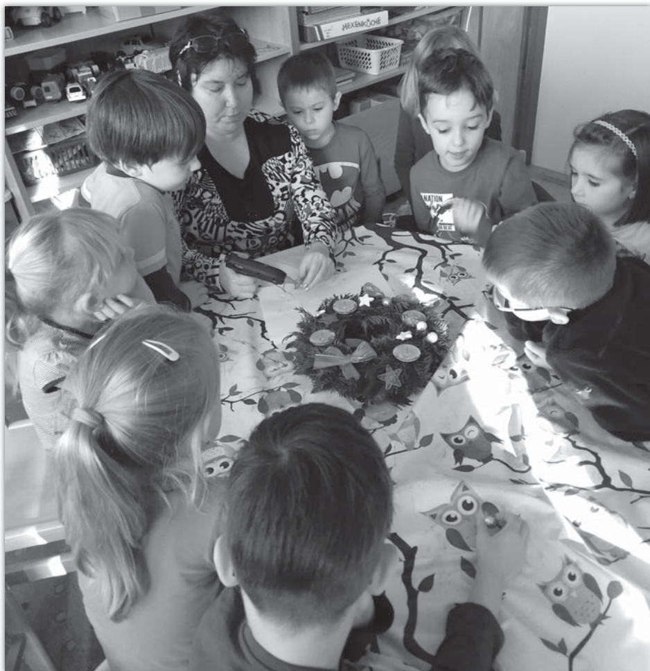
Výroba adventních věnečků