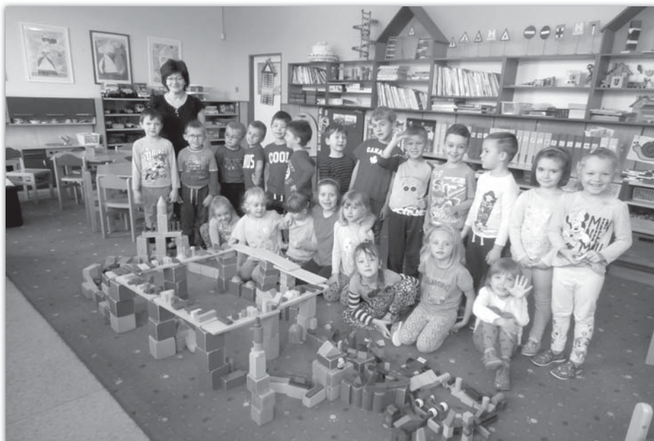
Třída Včeliček při dopoledních hrách