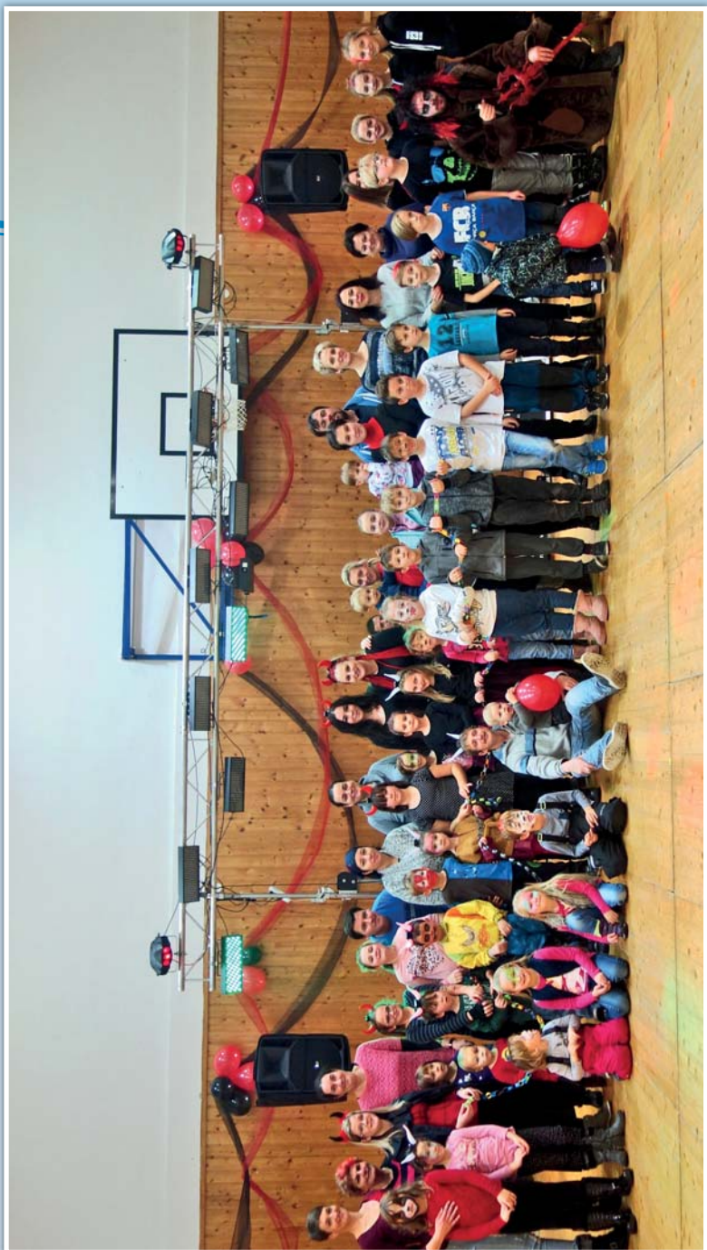
Čertovské harašení - 2.12.2017