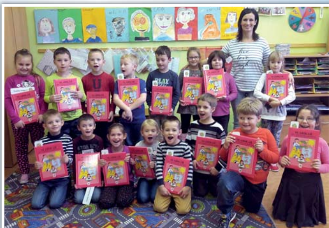
Základní škola - slavnostní předání slabikářů – 16. listopad 2017