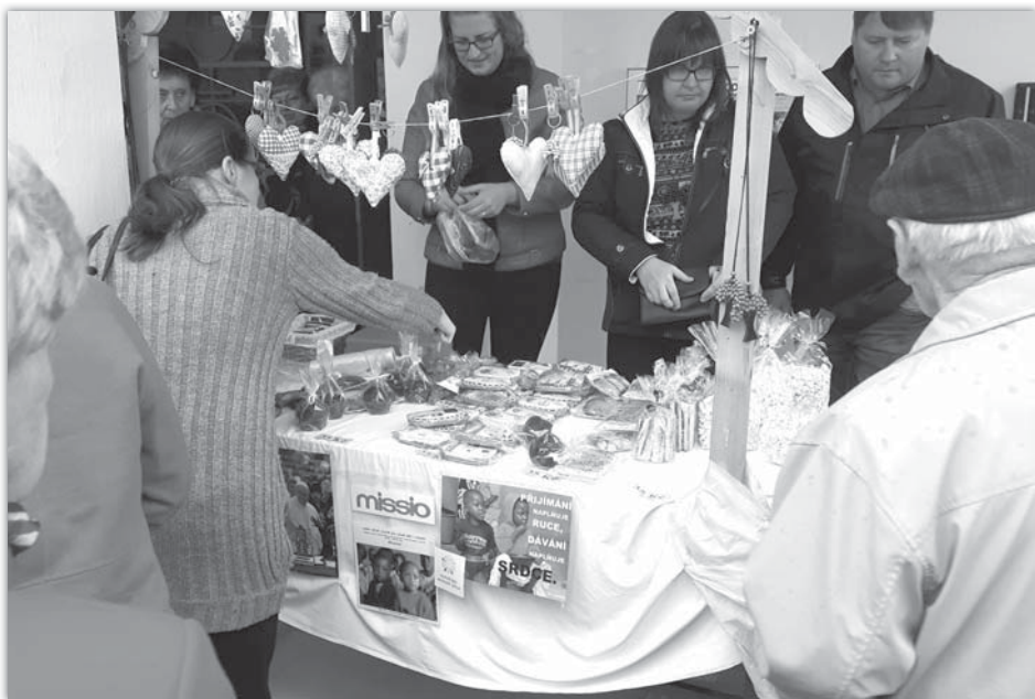
Misijní jarmark - 22. 10. 2017