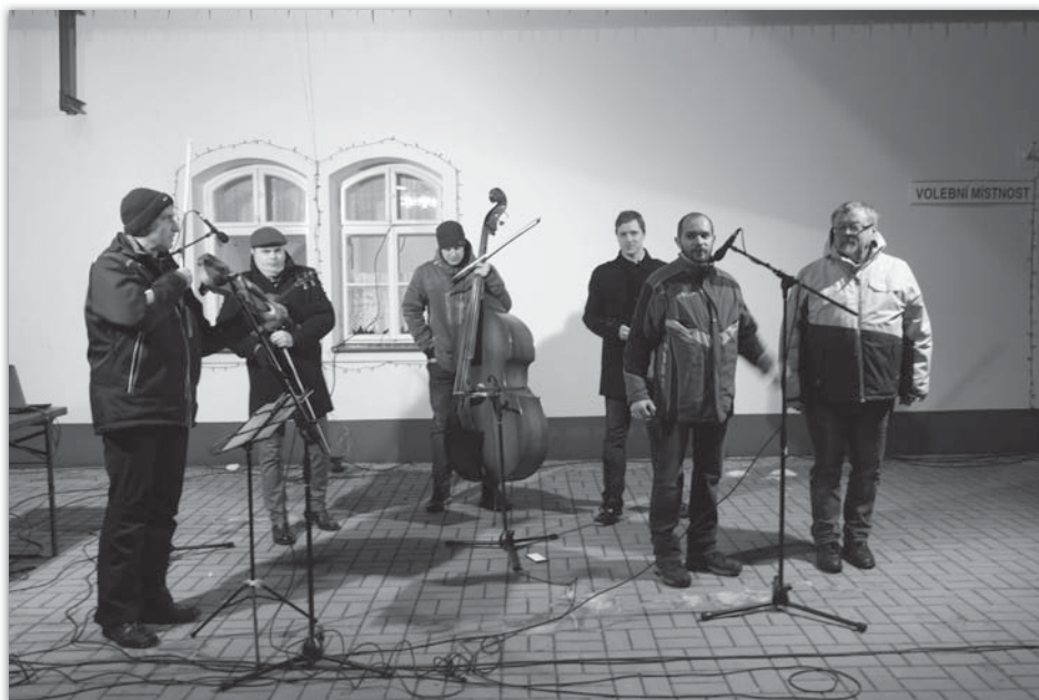
Rozsvícení obecního vánočního stromu – 3. 12. 2017