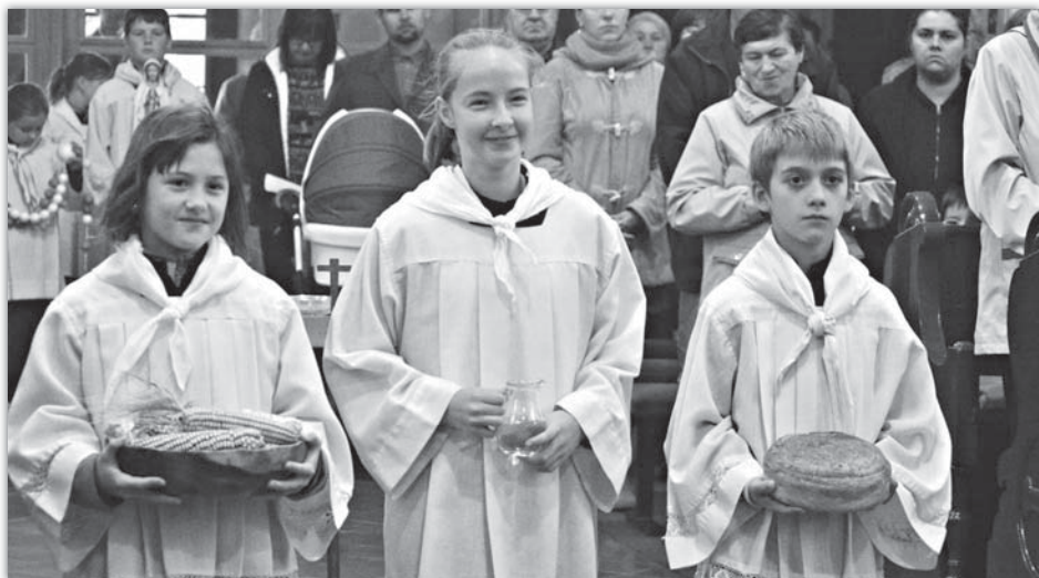
Misijní neděle - 22. 10. 2017