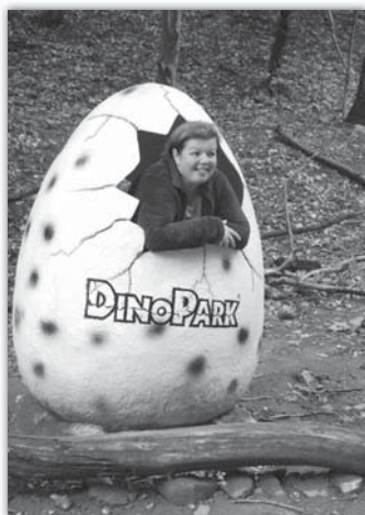
Návštěva dinoparku – 16.9.2017