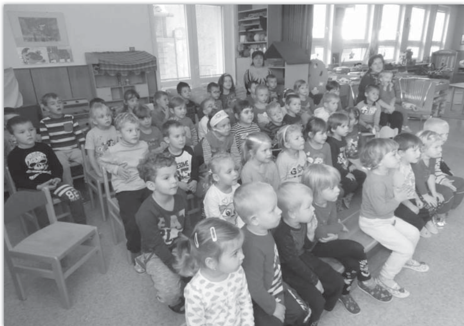
Loutkové divadlo Šikulka