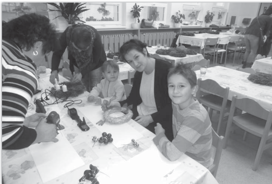
Výroba adventních věnečků