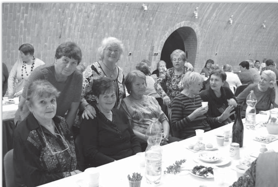
Návštěva Klubu důchodců z Brezové pod Bradlom – 19. 10. 2017