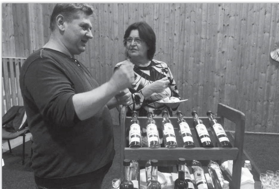
Ochutnávka pomazánek a destilátů – 13. 10. 2017