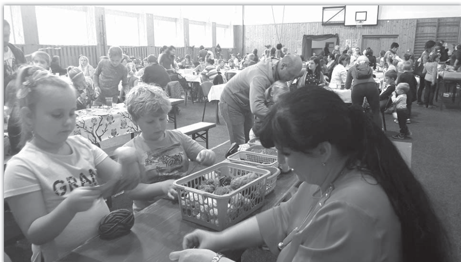
Podzimní dostaveníčko – 12. 10. 2017