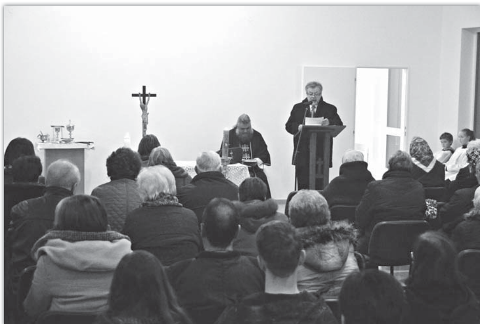
Bohoslužba v nové smuteční síni – 2. 11. 2017