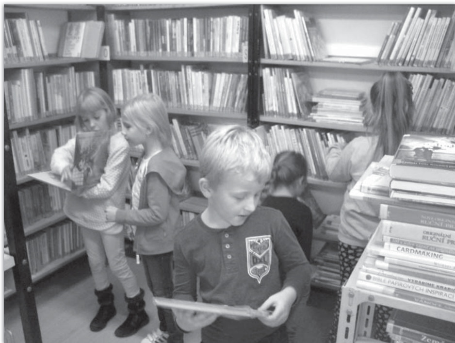
Návštěva knihovny - 25. 10. 2017