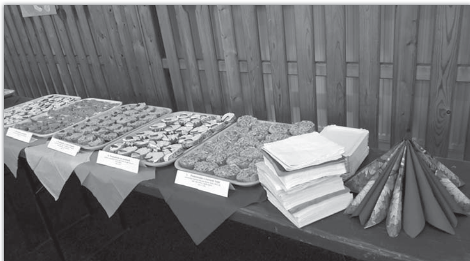
Podzimní dostaveníčko – 12. 10. 2017