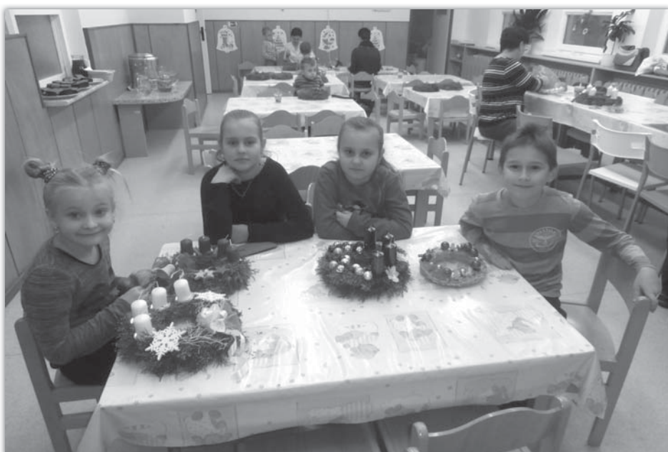
Výroba adventních věnečků