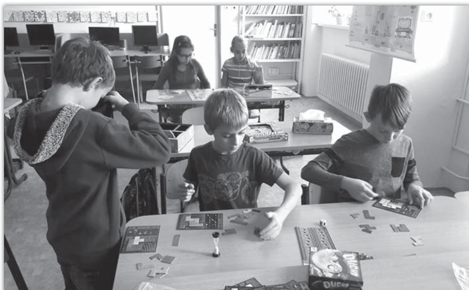
Klub zábavné logiky a deskových her