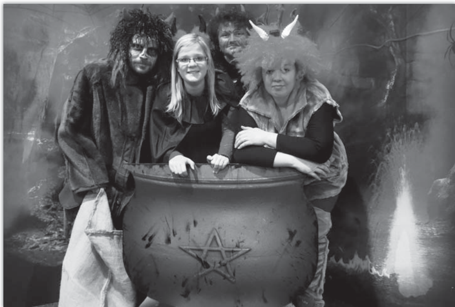
Čertovské harašení – 2. 12. 2017