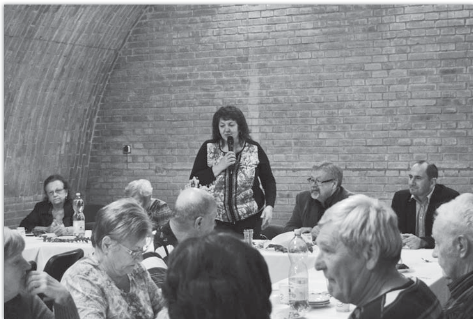
Návštěva Klubu důchodců z Brezové pod Bradlom – 19. 10. 2017