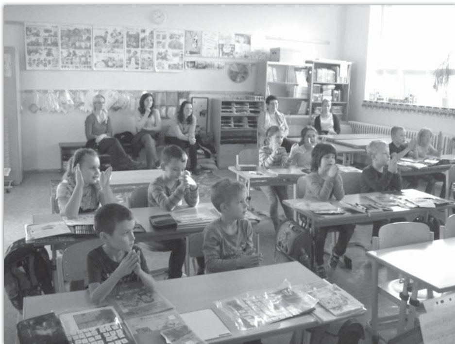
Den otevřených dveří – 12. 10. 2017