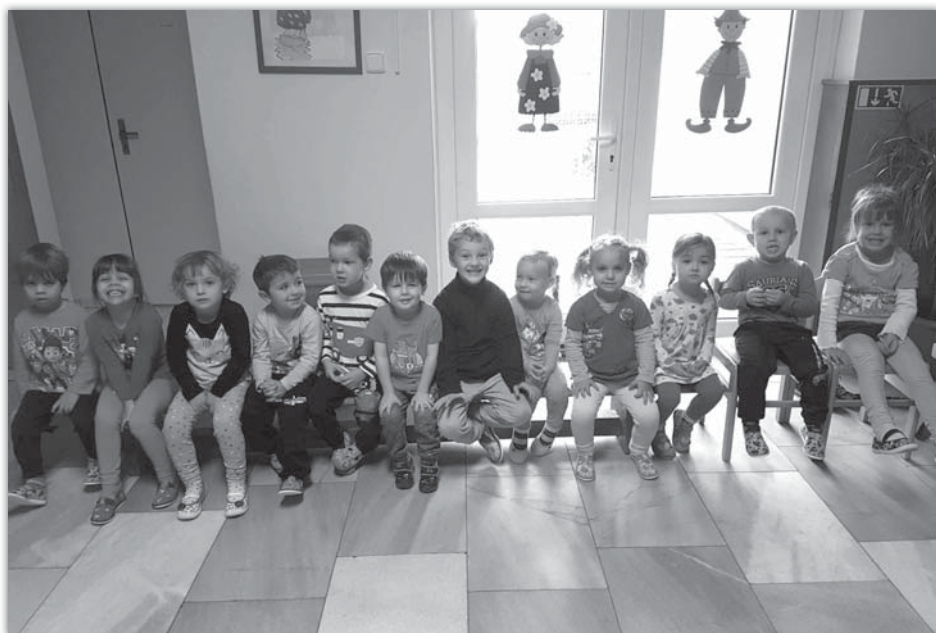
Ukončení podzimníčků - Berušky