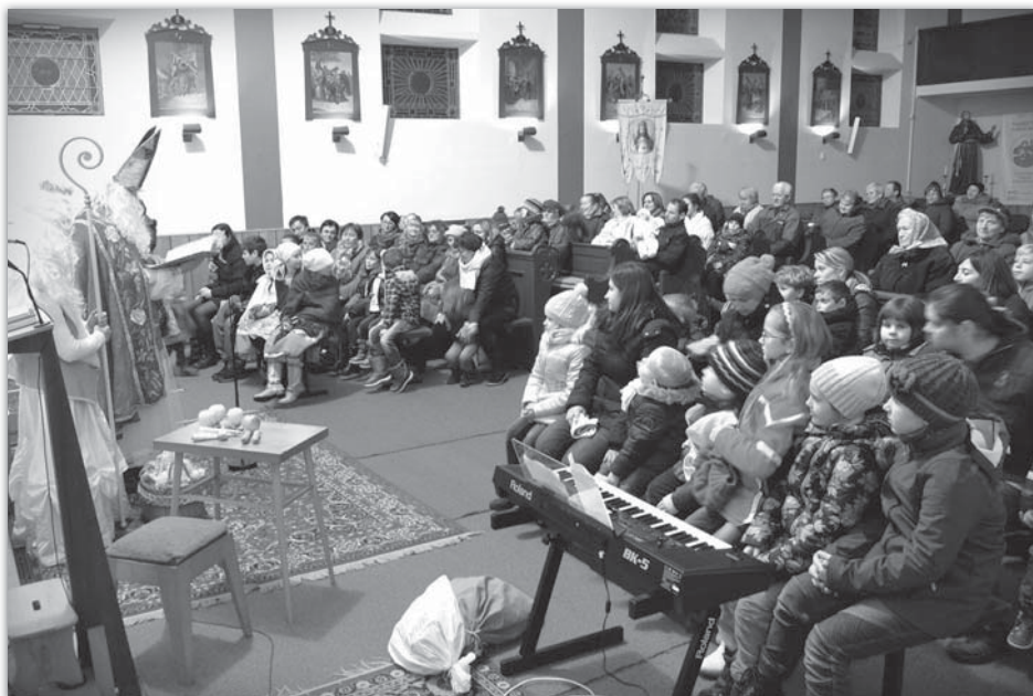
Mikulášská nadílka v kostele – 4. 12. 2017