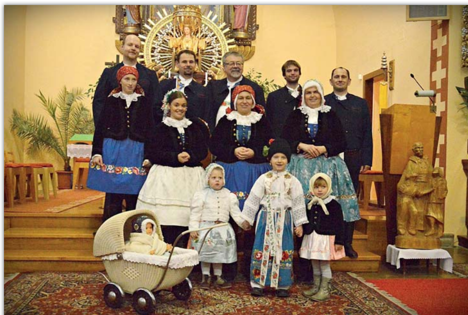
Společné foto krojovaných ze slavnosti patrocinia našeho kostela – 26. 11. 2017