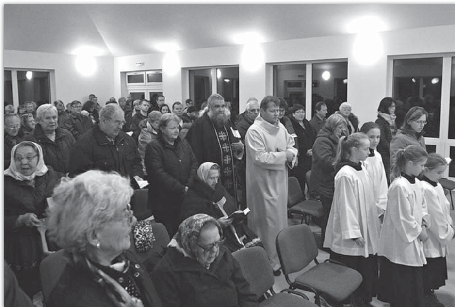
Bohoslužba v nové smuteční síni – 2. 11. 2017