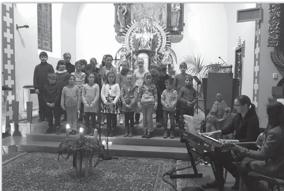
Misijní koncert – 10. 12. 2017