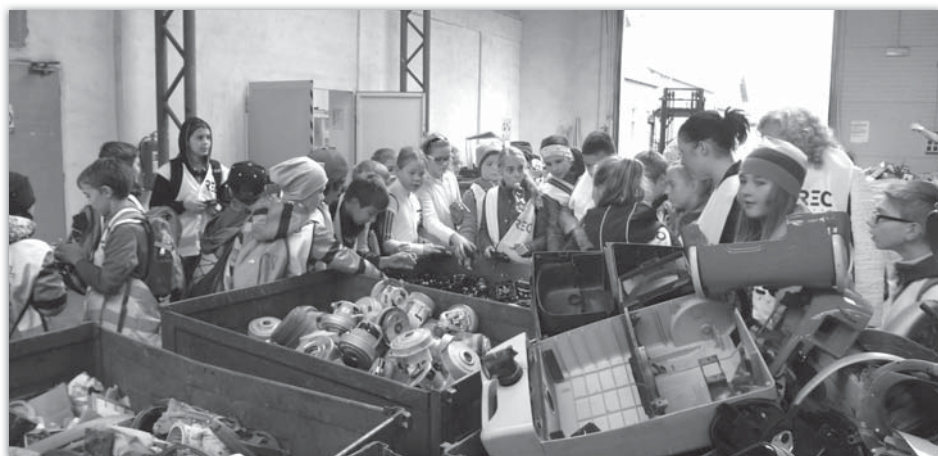
Projekt Ekologie – 5. 10. 2017