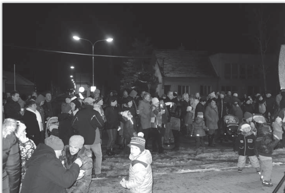
Rozsvícení obecního vánočního stromu – 3. 12. 2017