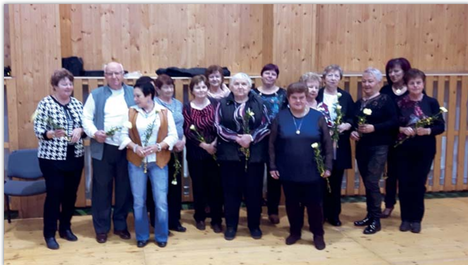
Jubilanti z řad seniorů