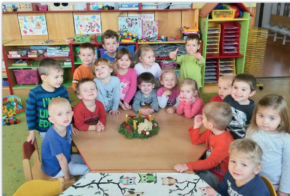
Mateřská školka – Berušky