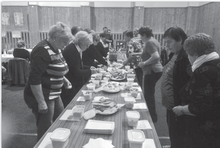
Ochutnávka pomazánek a destilátů – 13. 10. 2017