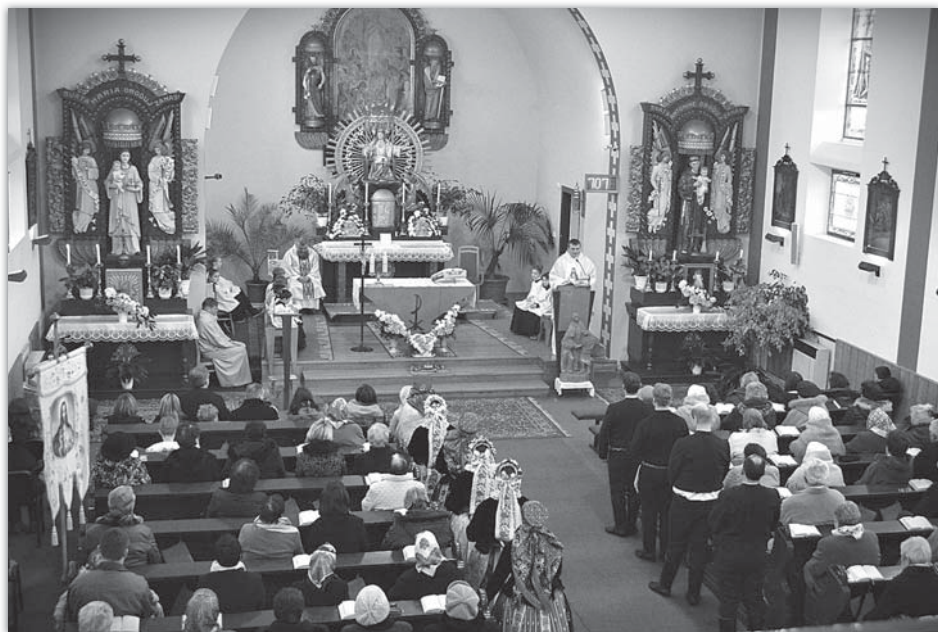
Slavnost patrocinia našeho kostela Ježíše Krista Krále – 26. 11. 2017