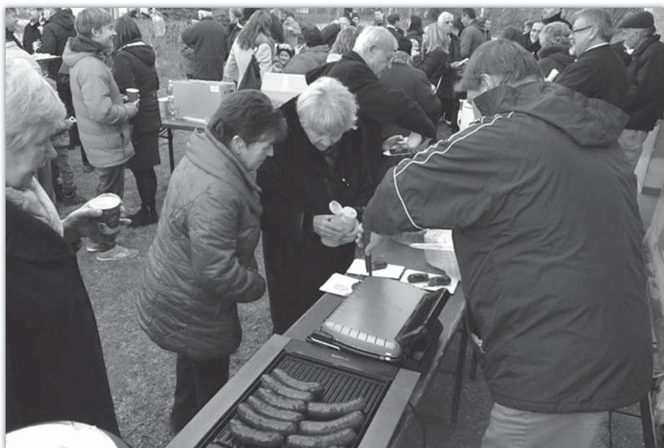
Pohoštění po bohoslužbě – 26. 11. 2017