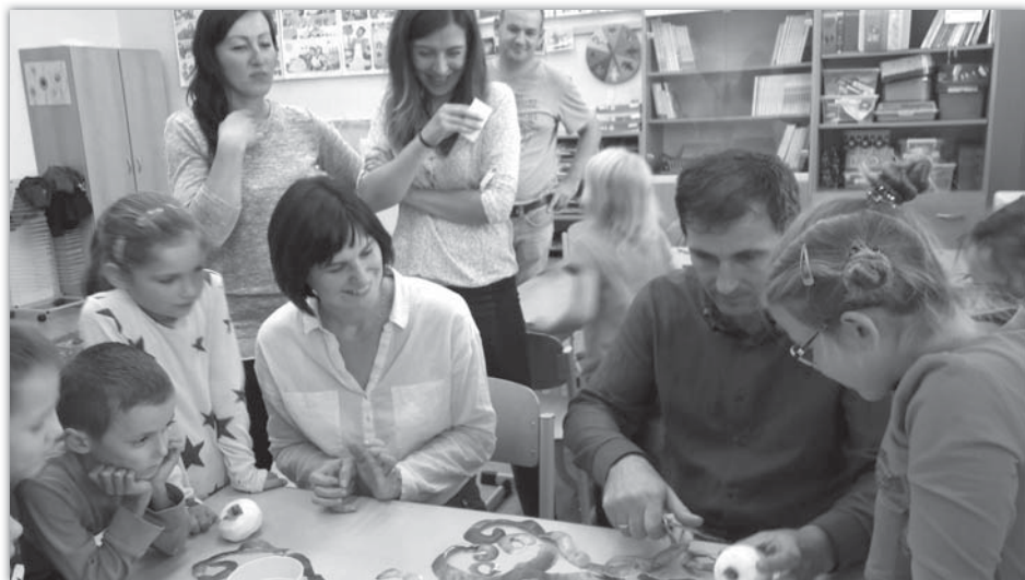
Jablkohrátky – 2. 10. 2017