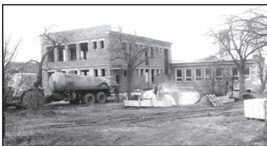
Čerpáno z kroniky ZŠ Sudoměřice a kroniky MŠ Sudoměřice. Mgr. Michaela Janečková