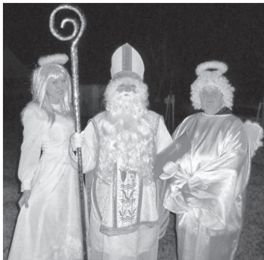
Z letošní návštěvy sv. Mikuláše s andělskou družinou.

V CHRÁMU PÁNĚ KRISTA KRÁLE V SUDOMĚŘICÍCH