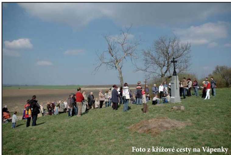
Foto z křížové cesty na Vápenky