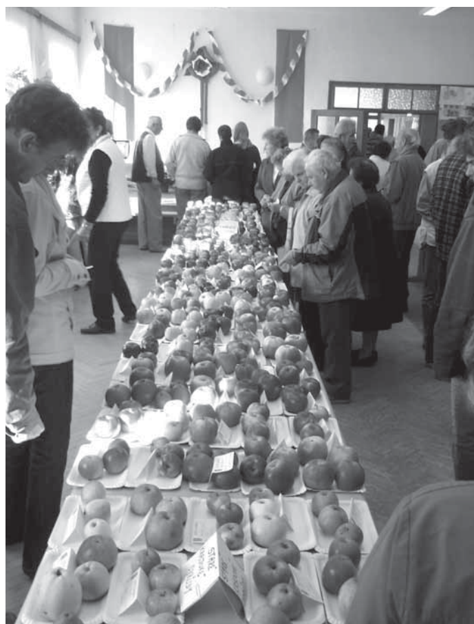
Foto výstava ovoce a tradičních jídel v Kozojídkách