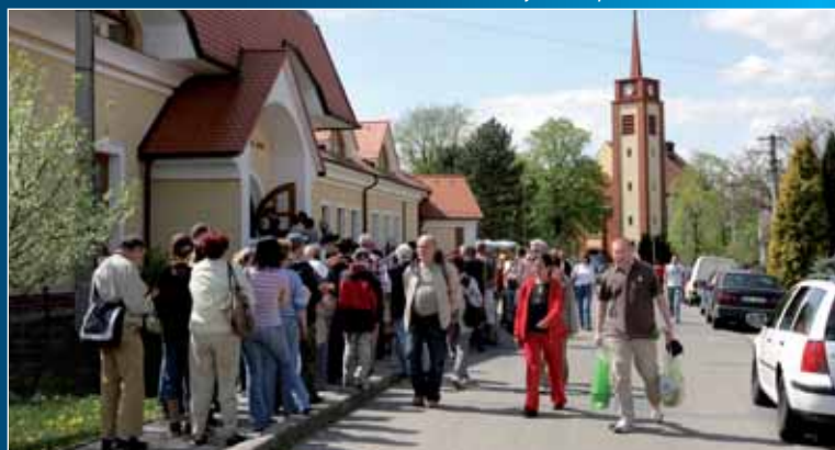
Svátek oskoruší přilákal do Tvarožné Lhoty davy lidí z celé republiky.