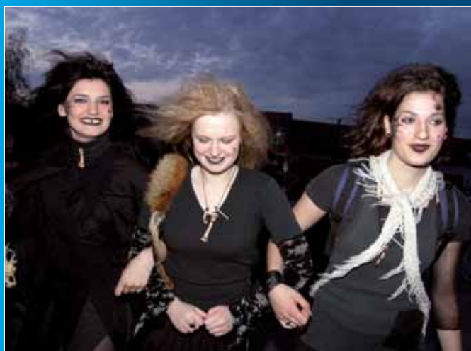
Pálení čarodějnic v Kněždubu.