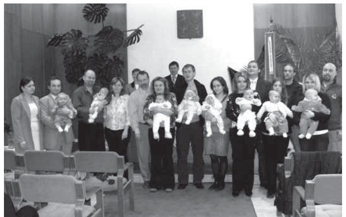
Stalo se již tradicí, že Obecní úřad v Hroznové Lhotě připravuje pro své nové občánky a jejich rodiče vítání do života.