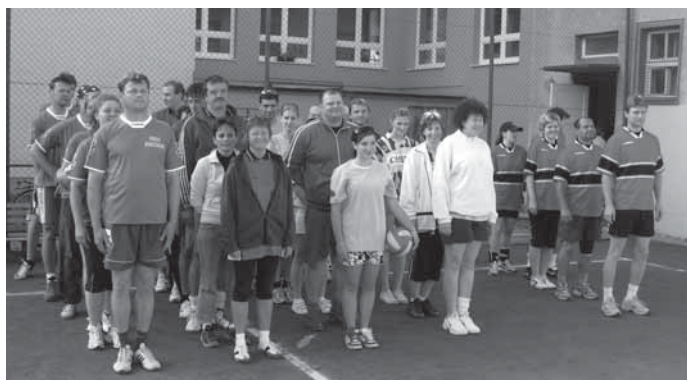
Volejbalového turnaje se zúčastnilo pět týmů.

Hroznová Lhota byla svědkem už devátého ročníku volejbalového turnaje mezi Hroznovou Lhotou, Kozojídkami, Tasovem, Kněždubem a pořádajícím Školním sportovním klubem Základní školy v Hroznové Lhotě. Zápolení se odehrálo v přátelské atmosféře. Vítězství letos zůstalo doma Školnímu sportovnímu klubu Základní školy v Hroznové Lhotě. Druhá příčka patřila Kněždubu, bronz vybojoval Obecní úřad Hroznová Lhota, čtvrté skončily Kozojídky a pátý Tasov (lef)