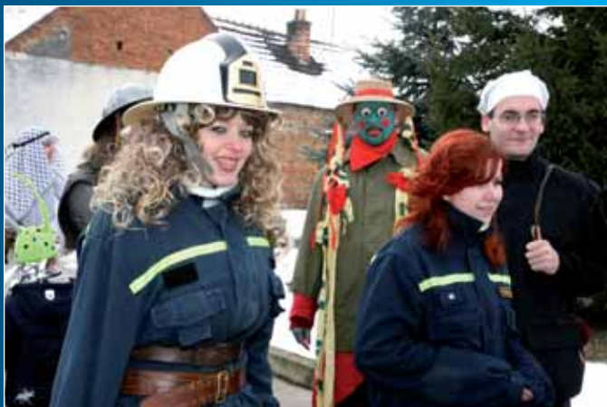
Veselý fašank v Kozojídkách.