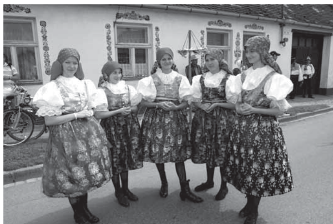
Mladé dívky čekají na průvod.