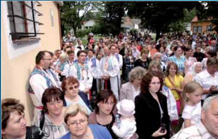
Slavnostních okamžiků se v Tvarožné Lhotě zúčastnily stovky lidí.