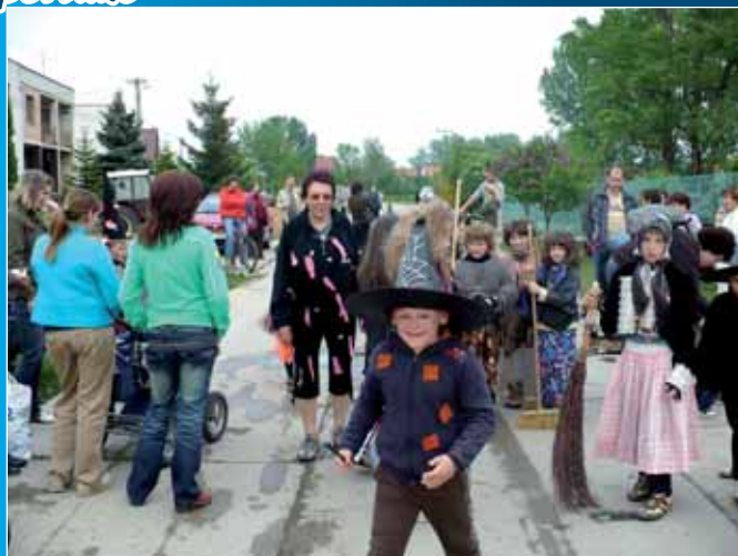
Tasovem proletěli čarodějové a čarodějnice.