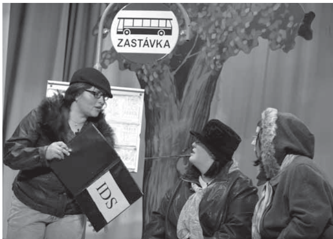
Jednu ze scének věnovali hroznolhotští ochotníci problematice nového integrovaného systému dopravy.

Divadelní ochotníci z Hroznové Lhoty jsou už dlouhé roky zárukou dobré zábavy. Nebylo tedy divu, že premiéra i další tři reprízy Hroznolhotských etýd byly letos na jaře vyprodány. Opakované výbuchy smíchu během představení a dlouhotrvající potlesk na závěr byly jasným důkazem, že divadelní-