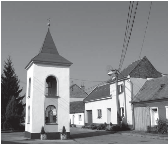
Kaple i zvonice od letošního roku září novotou.