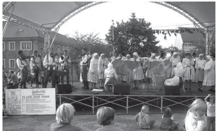
Nové podium ve Strážnici

4. oprava budovy TJ. Sokol Tvarožná Lhota, celkové náklady 165 000 uзнatelná dotace 90%, žadatel TJ Sokol – Realizací vzniklo kvalitní zázemí po pořádání akcí pro členy oddílu, občany, hlavně mládež i pro návštěvníky obce. Oživí se aktivity pro spolek i obec založením nového fotbalového družstva žáků, pořádáním mezinárodního turnaje mezi družstvy Irska, Slovenska a výběrem okresu a domácího celku, obnovou tradičního pouličního turnaje v obci, dětských sportovních soutěží, obnovou rodinného nohejbalového turnaje a ženského utkání