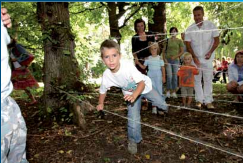
Pohádkový les do Strážnice láká děti i dospělé.