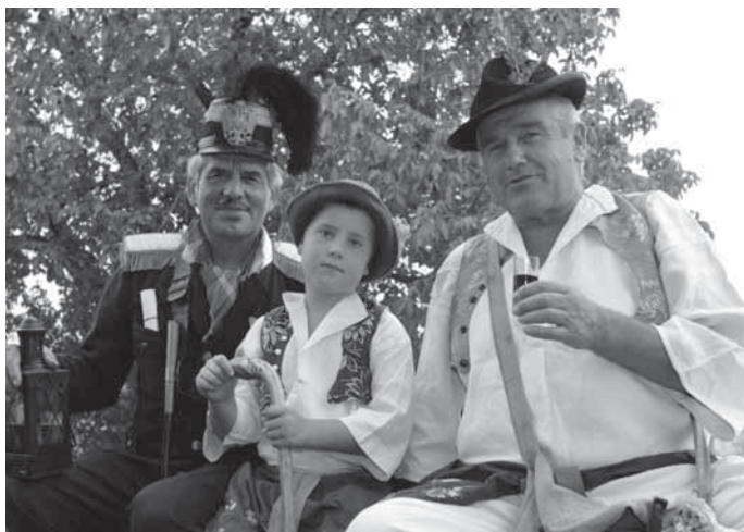
Dlouholetí aktéři strážnického zarážání hory si vychovávají své nástupce.