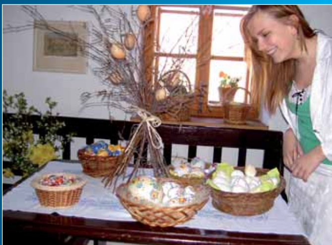
Velikonoční výstava měla úspěch.