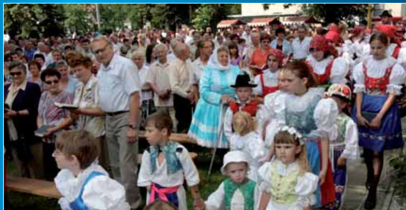
Radějovské poutě se zúčastnili domácí i přespolní.