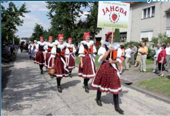
Oslavy dožínek v Kozojídkách.