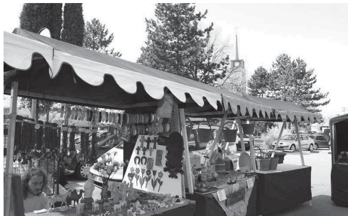
Nové stánky na Slavnosti oskoruší ve Tvarožná Lhotě

V rámci projektu vzniklo zařízení turistické infrastruktury : značky a směrovky tras, dřevěné sedačky, opěrky na kola a cedule s mapou. Vlastní umístění je projektováno tak aby bylo sdruženo se stávajícím systémem vinařských a naučných stezek. Ve frekventovaných místech v u nádrže Mlýnky, mezi obcí Tvarožná Lhota a Radějov a mezi obcemi Hroznová Lhota a Tasov se také opravily povrchy cyklotras. Náklady projektu přesáhnou částku 3,6 mil Kč. Většina prací je již hotova. Na