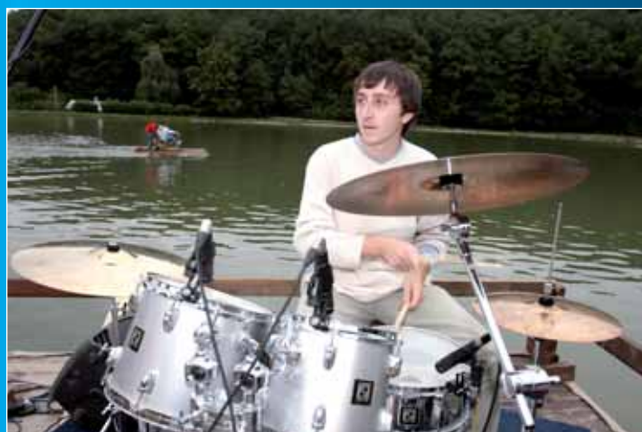
V Tvarožné Lhotě se uskutečnil Festival na vodě.