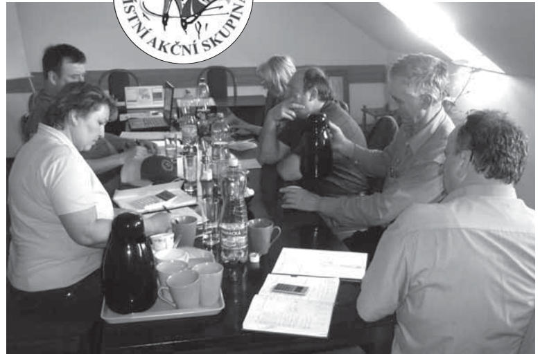
Jednání rady MAS STRÁŽNICKO

Jednotliví žadatelé odevzdávají v kanceláři své projekty se žádostí o podporu v rozsahu předepsaném pravidly Programu rozvoje venkova (PRV). Projekty jsou následně zkontrolovány po administrativní stránce, a pokud obsahují vše, co obsahovat mají, jsou předány výběrové komisi MAS, která dle předem stanovených kritérií oboduje, jednotlivé žádosti a stanoví pořadí žadatelů. Veškeré materiály se pak předávají ke kontrole Státnímu zemědělskému intervenčnímu fondu (SZIF), který vše ještě znovu překontroluje a vyhodnotí. Výsledkem je smlouva