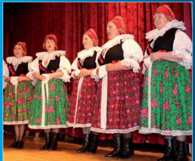
V Kněždubu se uskutečnil další benefiční koncert.