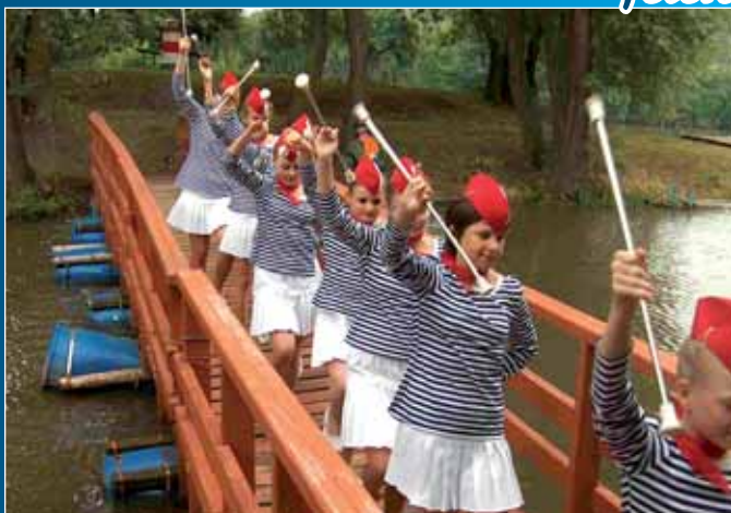
Při oslavách sedmdesátého výročí výklopníku v Sudoměřích nechyběly mažoretky.