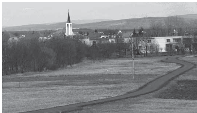
Nová cyklostezka vede v Sudoměřicích od Bařova kanálu kolem fotovoltaické elektrárny a stodol ve směru na Petrov.