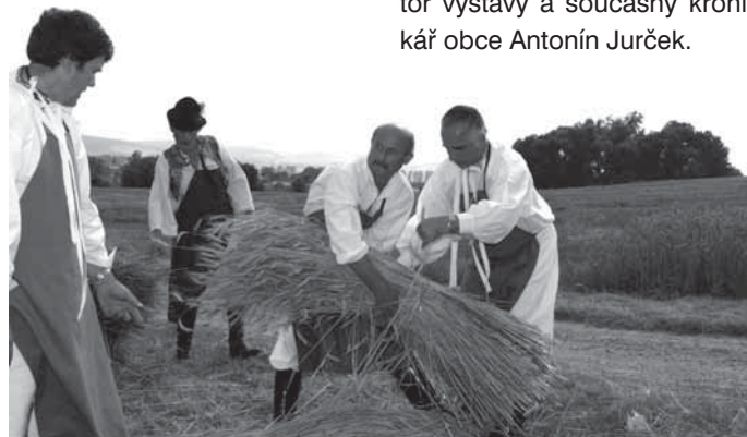
Při dožínkách v Kozojídkách nechyběla ukázka tradičního sklizení obilí.