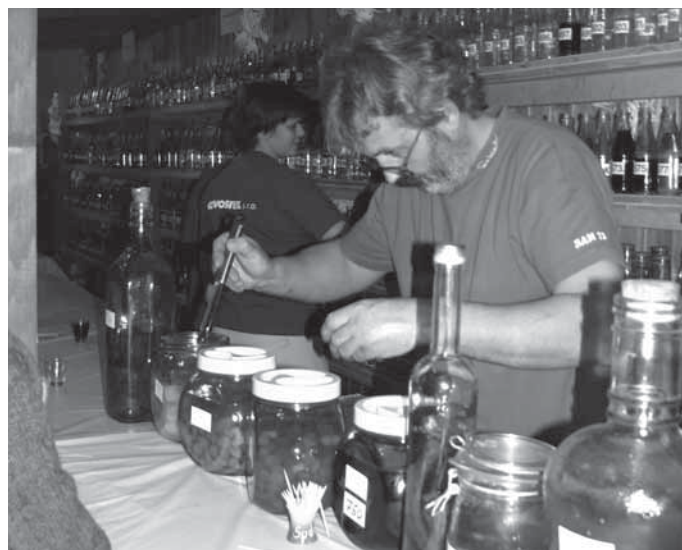
Návštěvníci si na tradičním košty pálenek v Sudoměřicích mohli vybírat ze sedm set padesáti jedna vzorků.