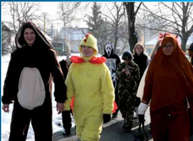
Oslavy fašanku v Hroznové Lhotě.