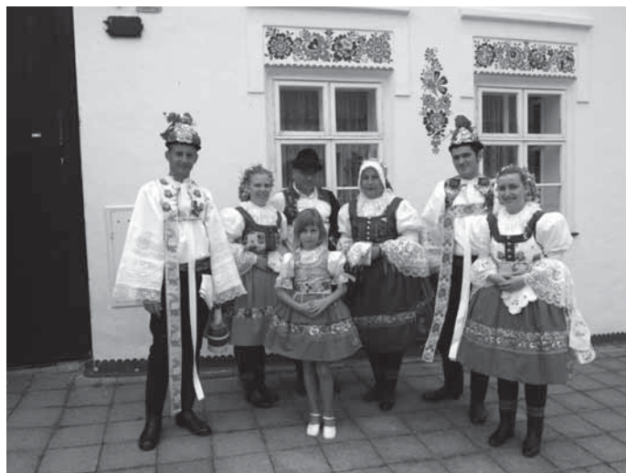
Při strážnických slavnostech v průvodu nechyběli zástupci Petrova, kteří se také objevili v sobotním pořadu Strážnická svatba.

Na scéně se nakonec objevilo okolo dvou stovek aktérů. Jednalo se převážně o současné i bývalé členy folklorních sou-