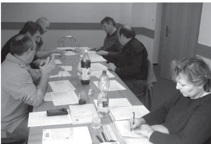
Jednání výběrové komise MAS STRÁŽNICKO