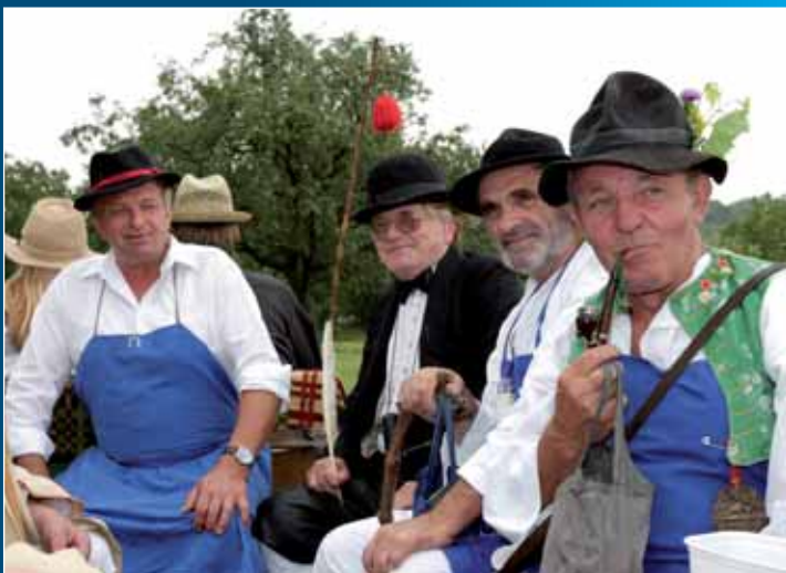
Hotaři z hor vinohradnických zarábali ve Strážnici horu.