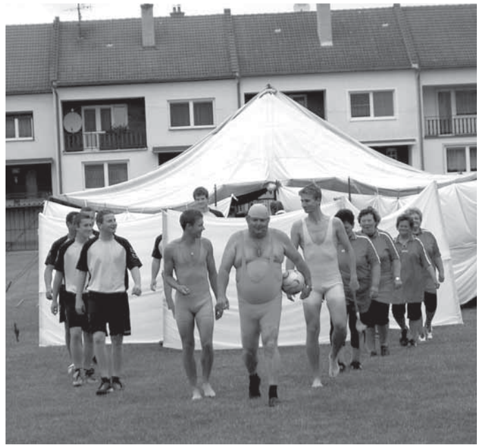
Účinkující při kulturním programu tradiční Jánské poutě vyvolávali mezi diváky výbuchy smíchu.

vedly, že jim nápady a humor rozhodně nechybí. Všichni jejich fandové se tak mohou už