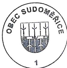
Stanislav Tomšej starosta města

Poučení : Proti rozhodnutí zadavatele o vyloučení z účasti v zadávacím řízení má uchazeč právo podat zadavateli námitky, a to do 10 dnů ode dne doručení tohoto oznámení.